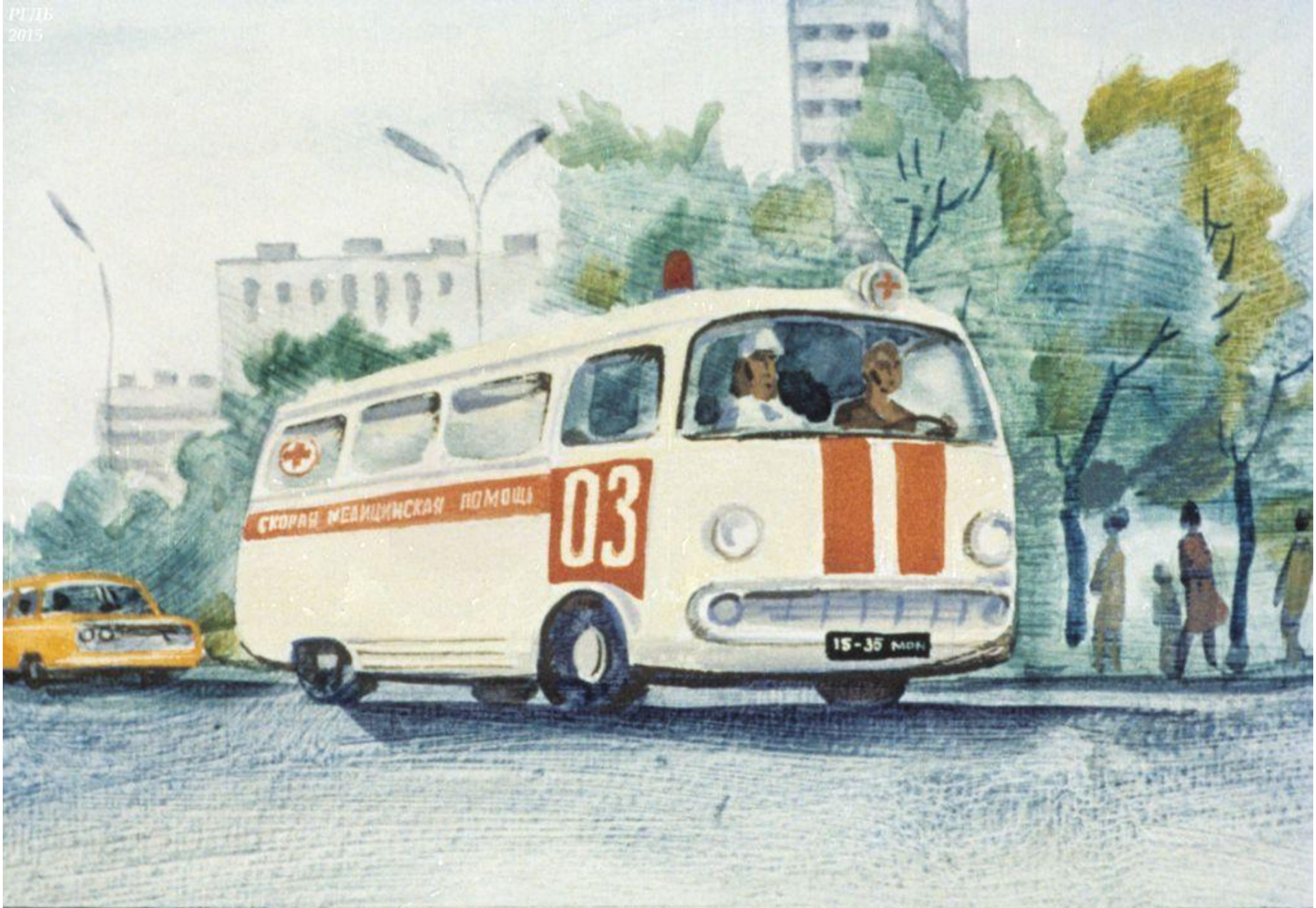
«Скорая помощь» увезла мальчика в больницу.