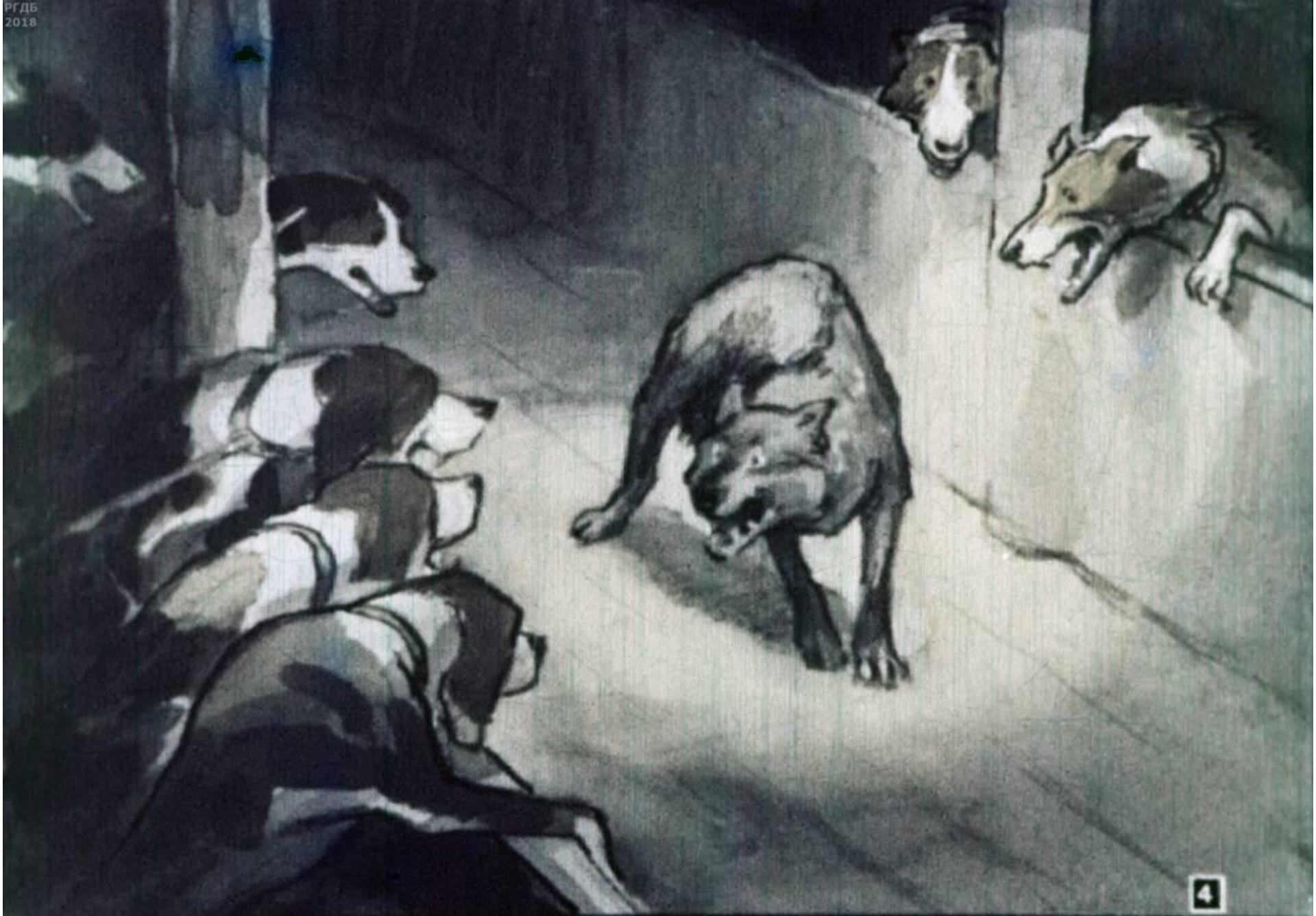
Попал на псарню.