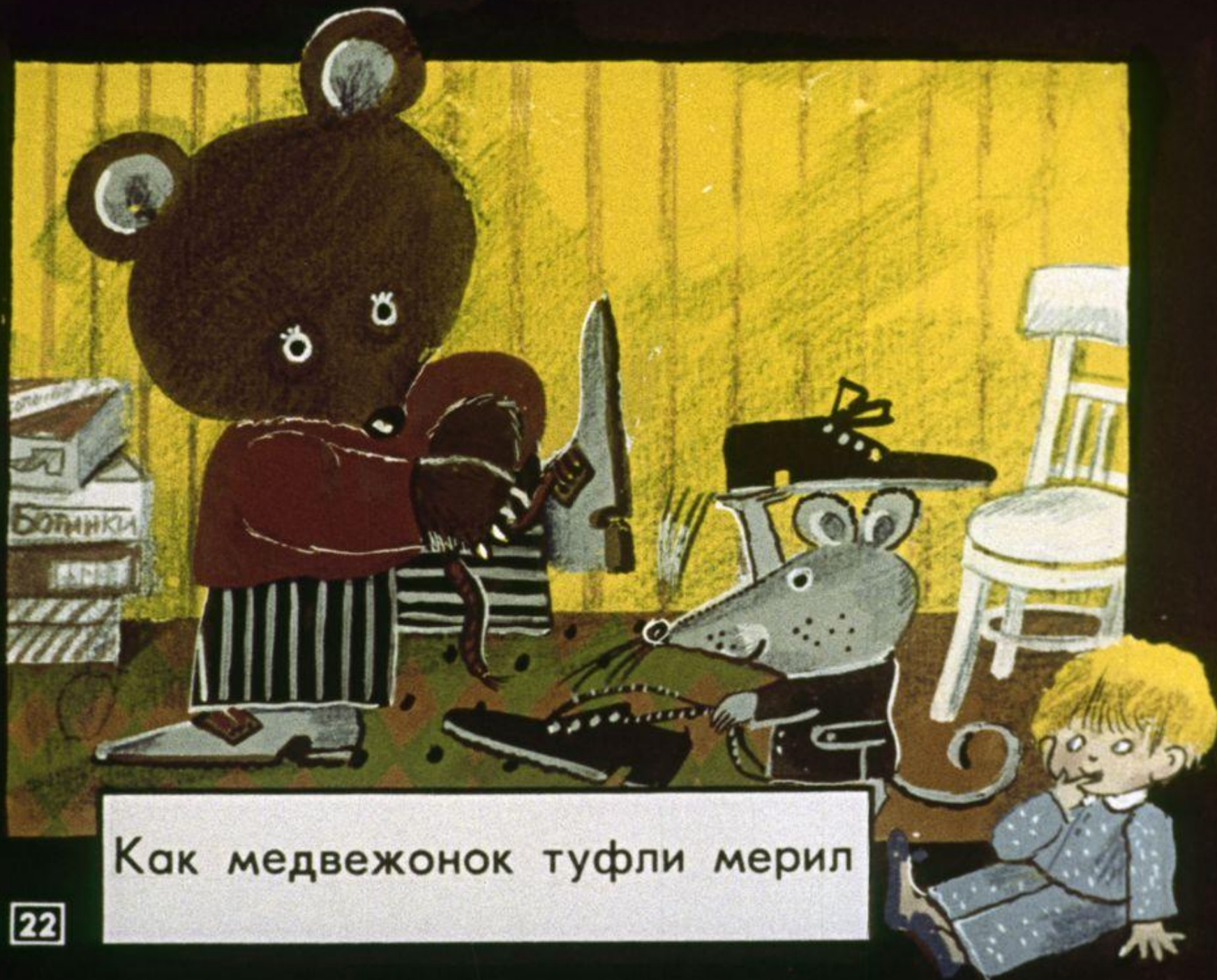
Как медвежонок туфли мерил