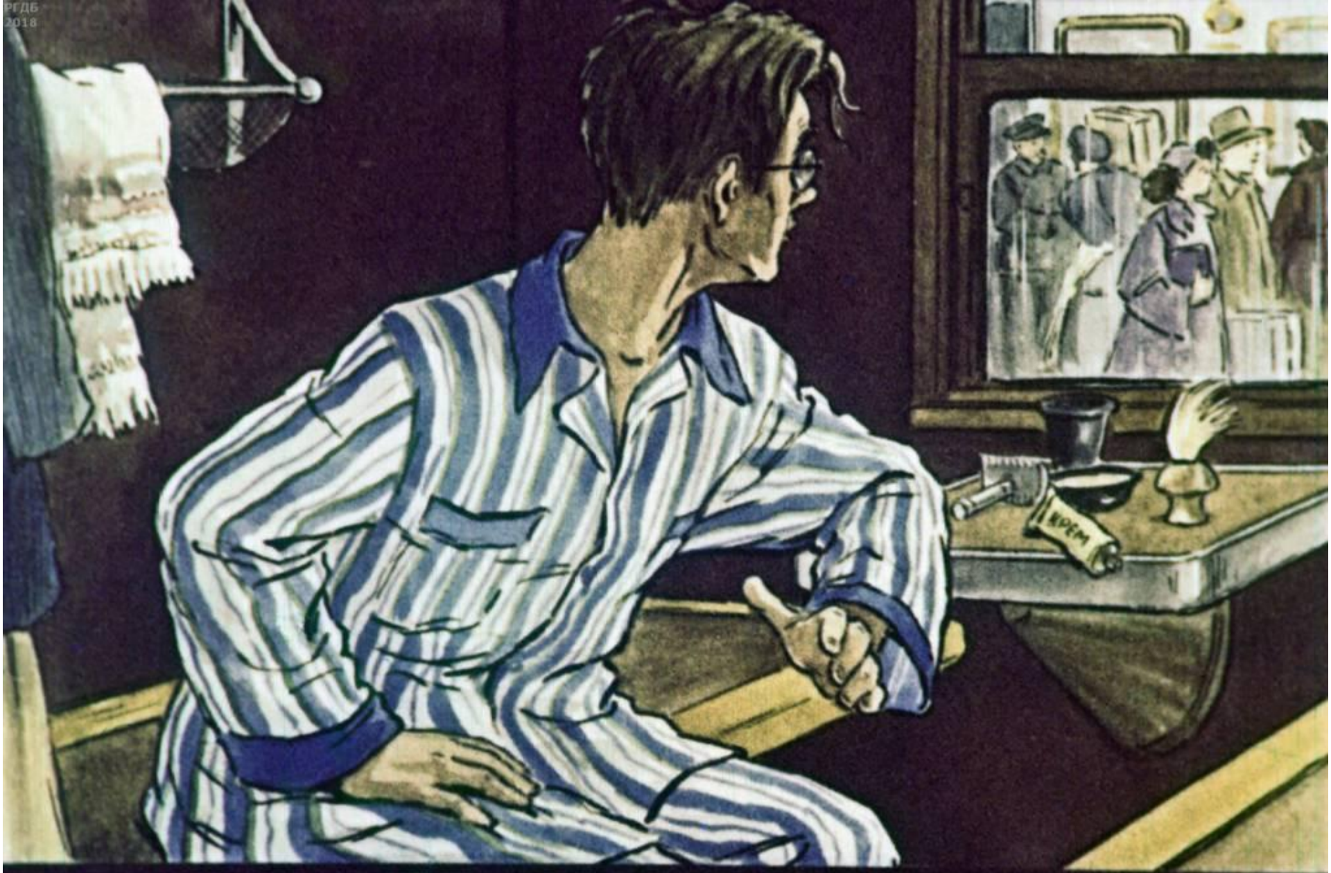
И опять взглянул в окошко,