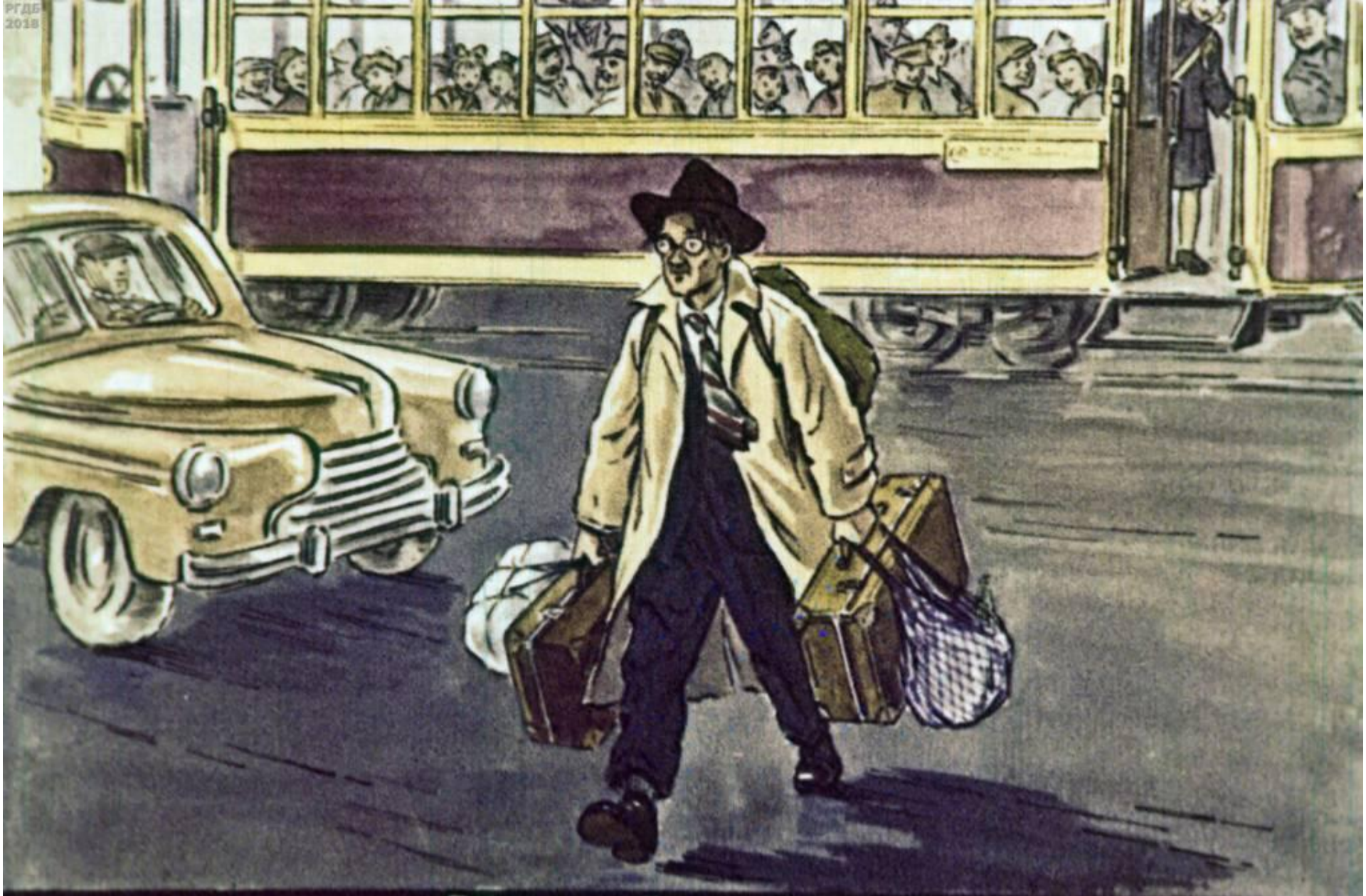
Вот какой рассеянный С улицы Бассейной!