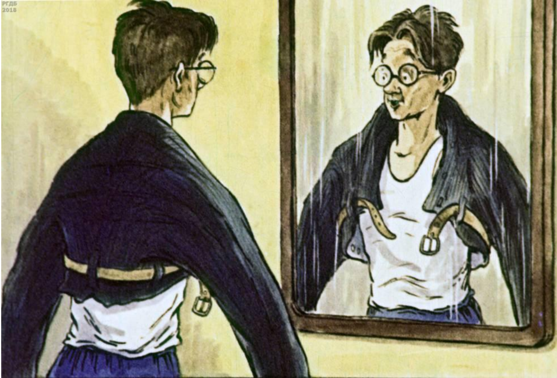
Вот какой рассеянный С улицы Бассейной!