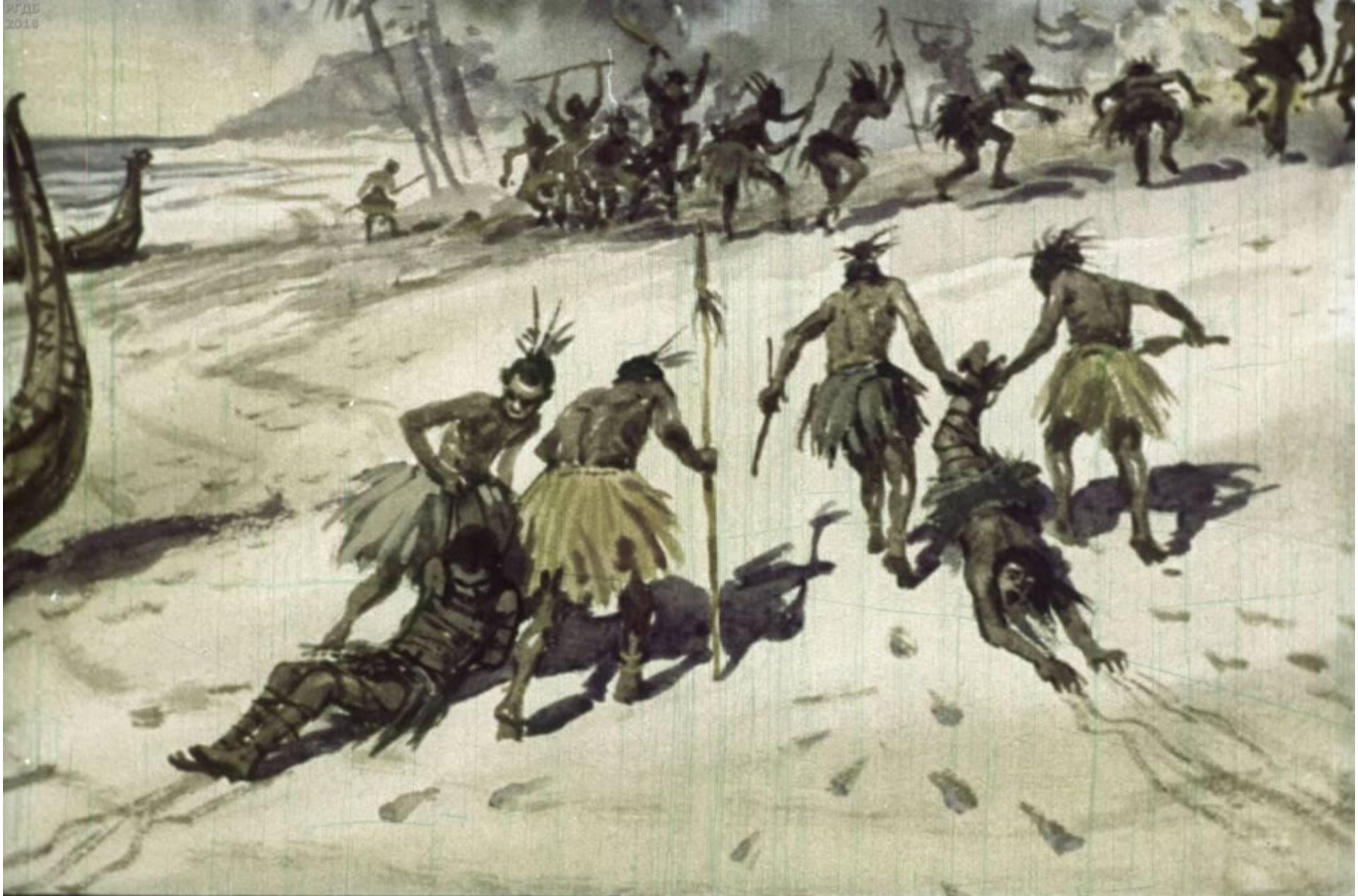
Ди́кари развели костёр, вытащили из лодок 2 пленников и поволокли к костру.