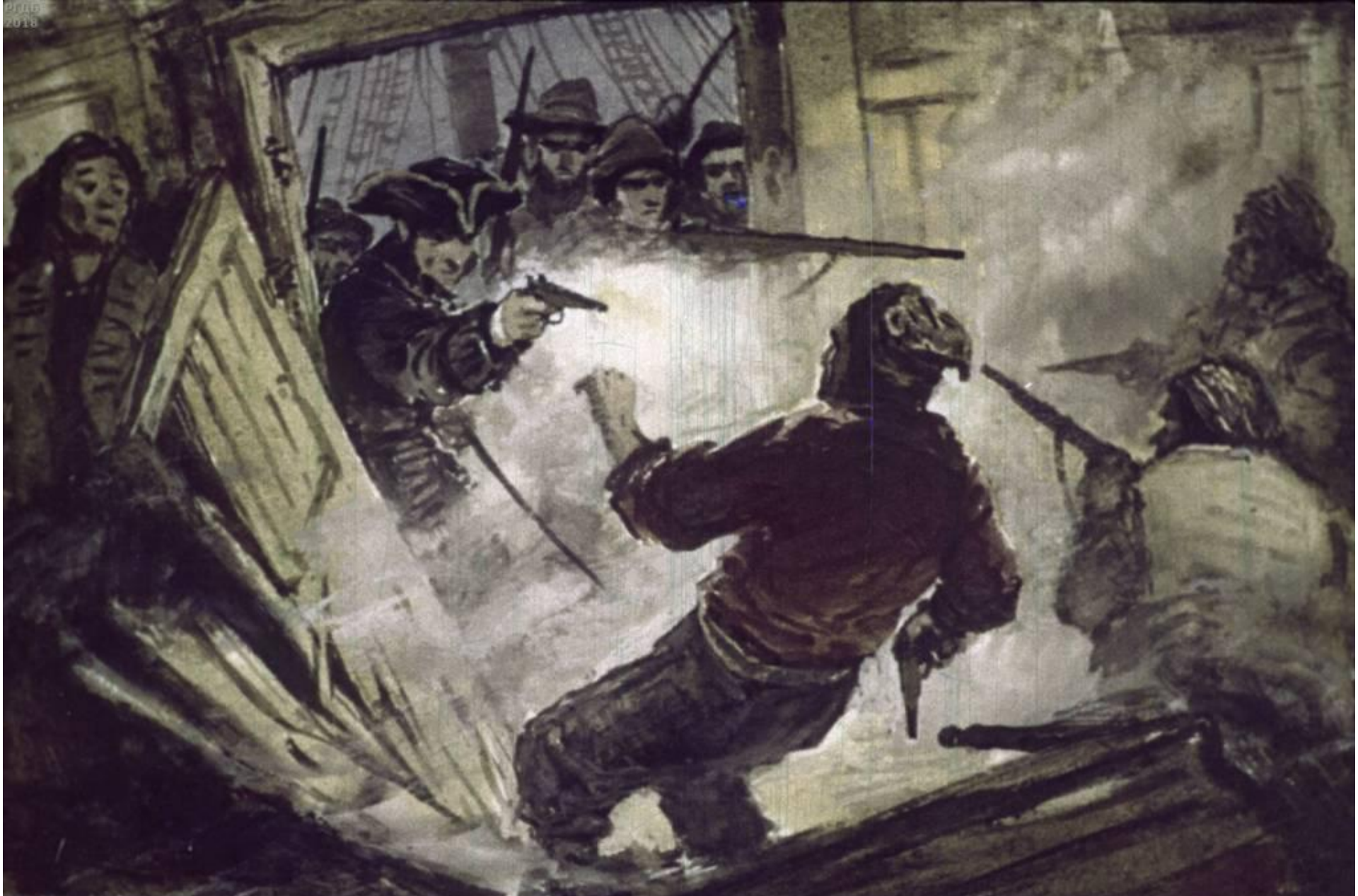
Капитанский отряд действовал дружно и храбро. Мятежники были схвачены и обезоружены.