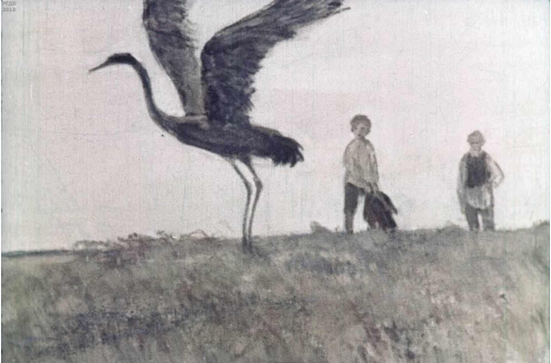
потом скакнул вперёд, сильно взмахнул крыльями, взлетел и, нурлыкая, помчался за своей родной стаей. [27]