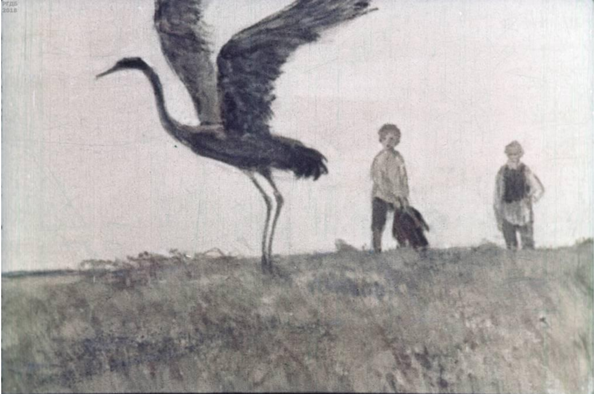
потом скакнул вперёд, сильно взмахнул крыльями, взлетел и, нурлыкая, помчался за своей родной стаей. [27]