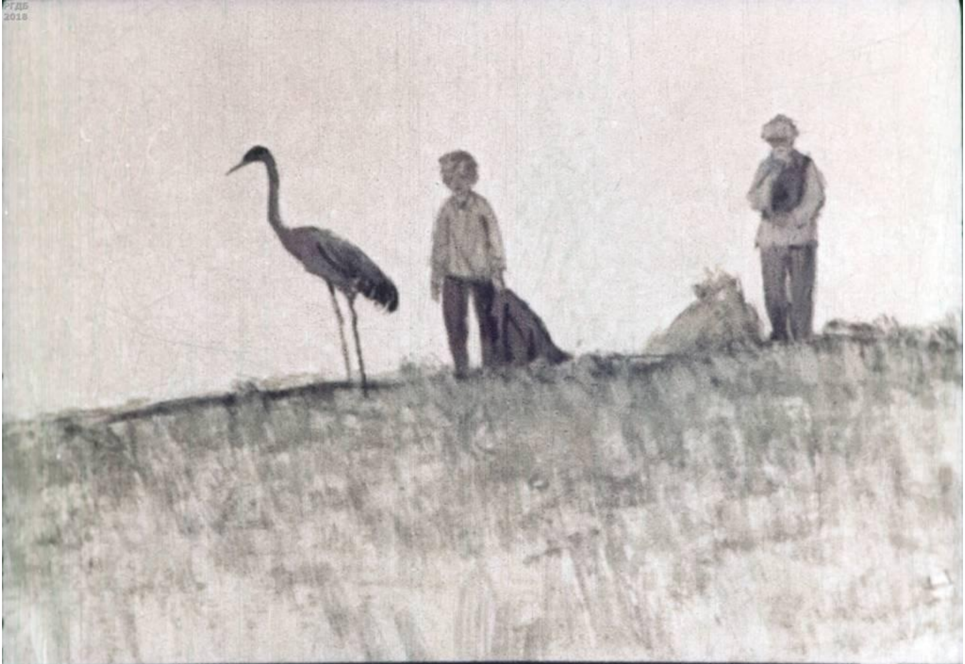
Сначала журавль стоял неподвижно,