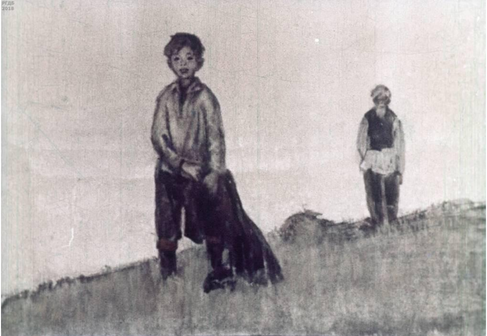
Вова долго глядел ему вслед.