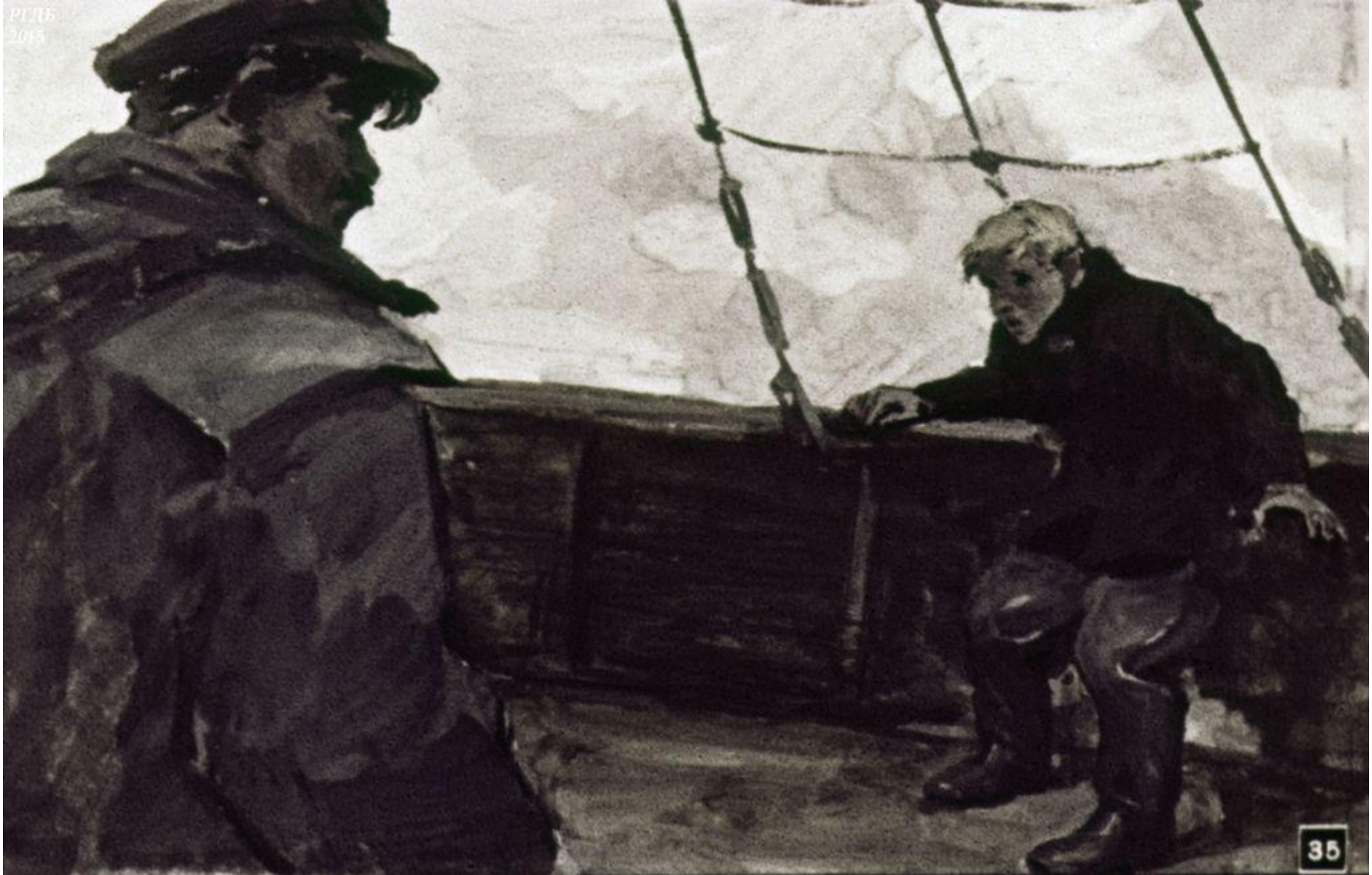
Подойдя к Сергею, старпом тихо сказал: „Трус. Шнура. Тьфу!“