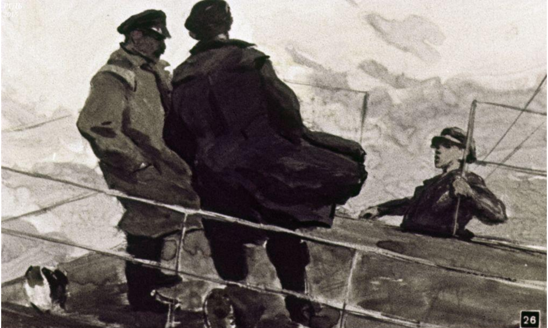
На капитанском мостике о чём-то негромко совещались Афанасьич и старпом. – „Вода прибывает, – сказал Петька. – Скоро будем пузыри пускать“.