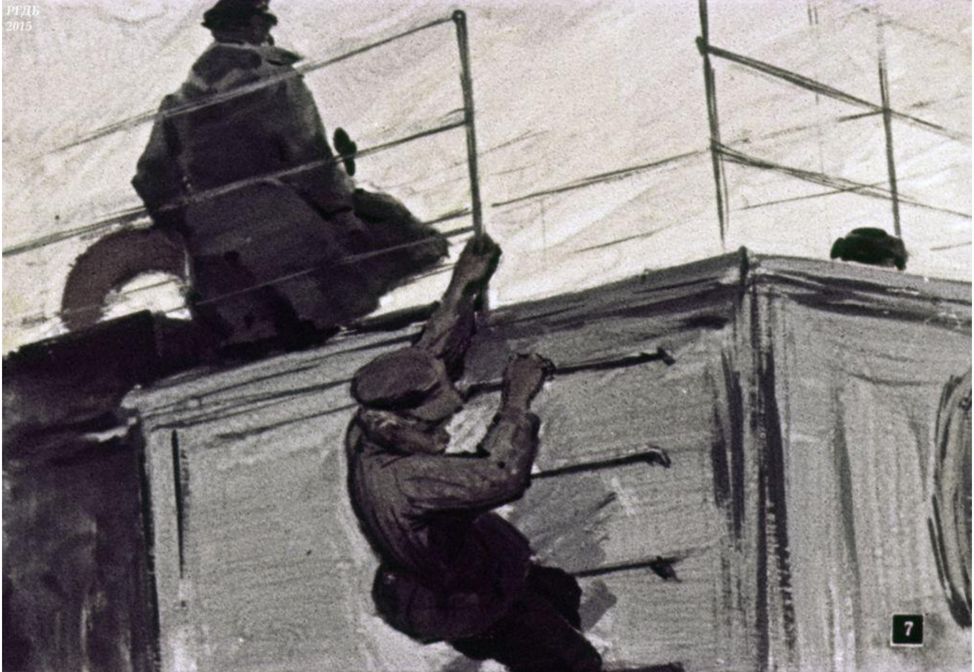
Петьна обиделся и полез в кубрик.