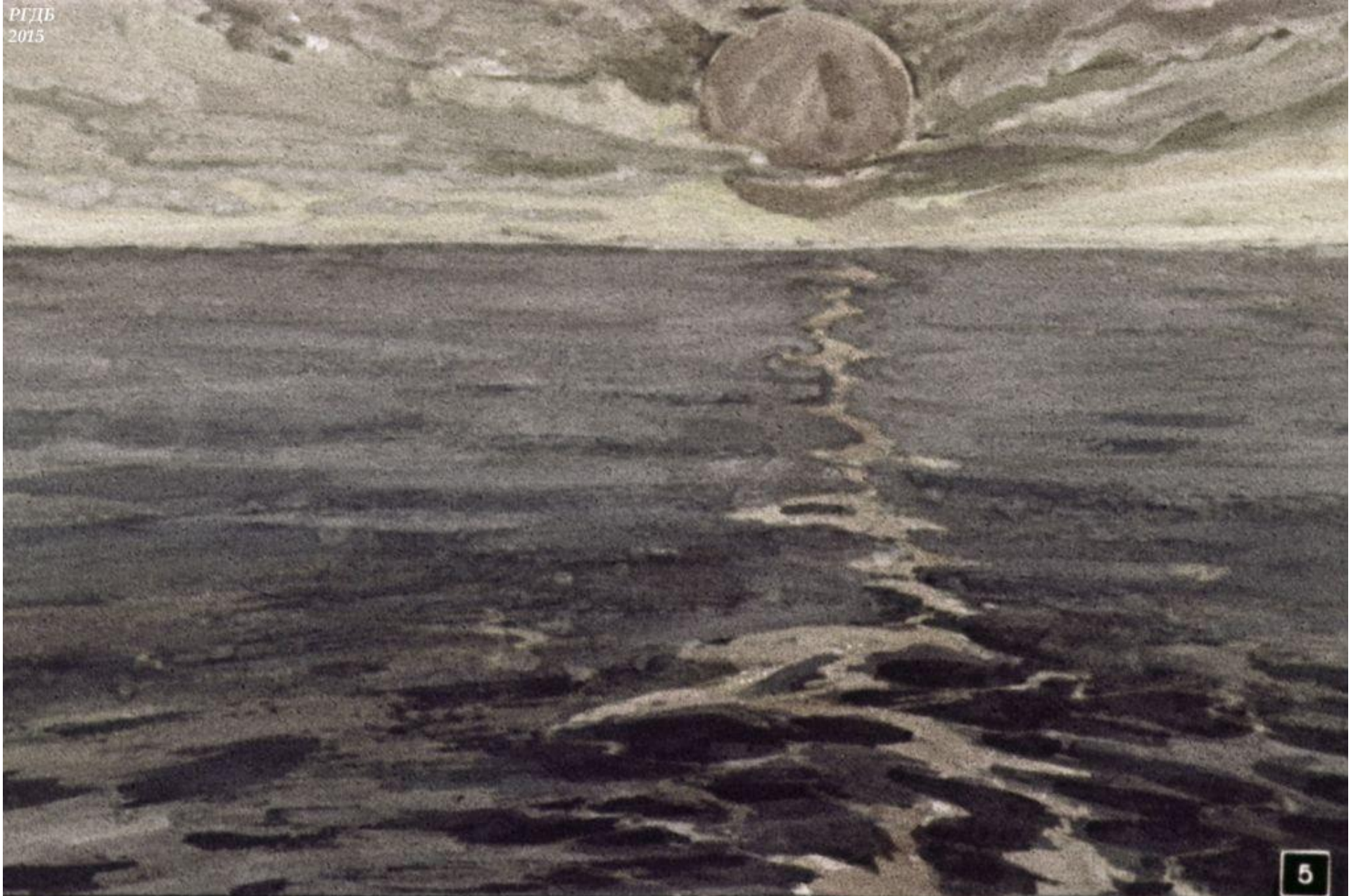
Грузное и неправдоподобно распухшее солнце расстелило перед судном узкую багряную дорогу.