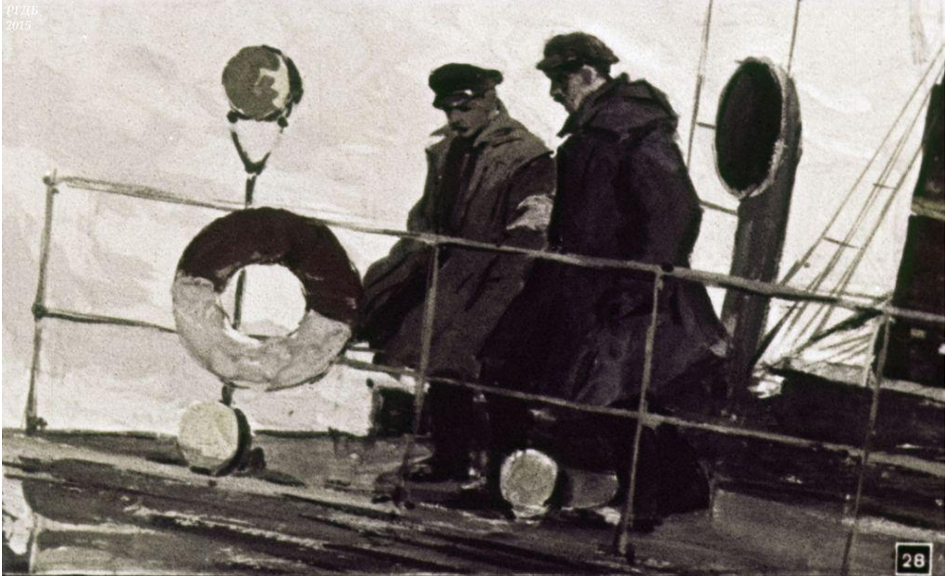
Капитан уставился в пол и тихо, но твёрдо ответил: „Не могу я человека на смерть посылать“. – „Тогда пусть решает команда“.