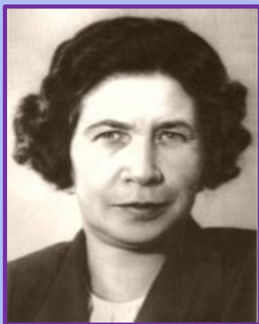
Валентина Александровна Осеева

Его герой задавался вопросом: «А как же я?»»