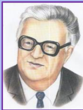
Валентин Дмитриевич Берестов