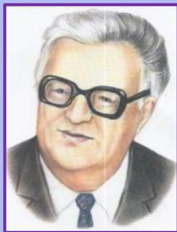
Валентин Дмитриевич Берестов