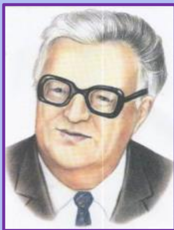
Валентин Дмитриевич Берестов