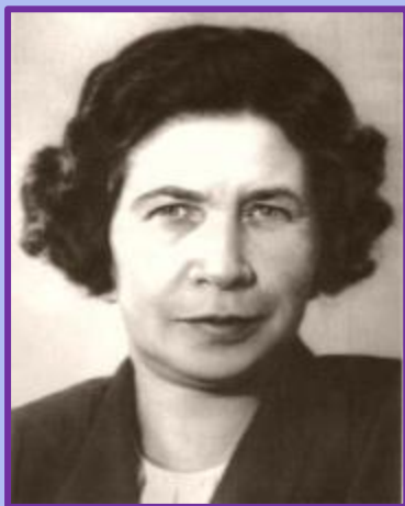
Валентина Александровна Осеева

Её герои узнают волшебные слова, учатся делать что-то хорошее и задаются вопросом «почему»?