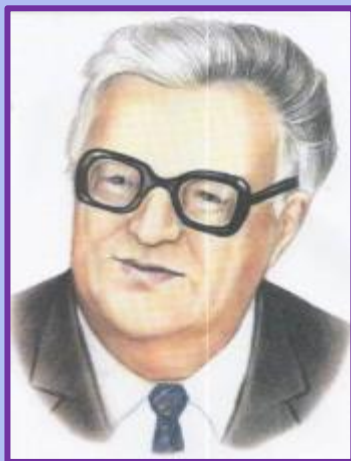
Валентин Дмитриевич Берестов