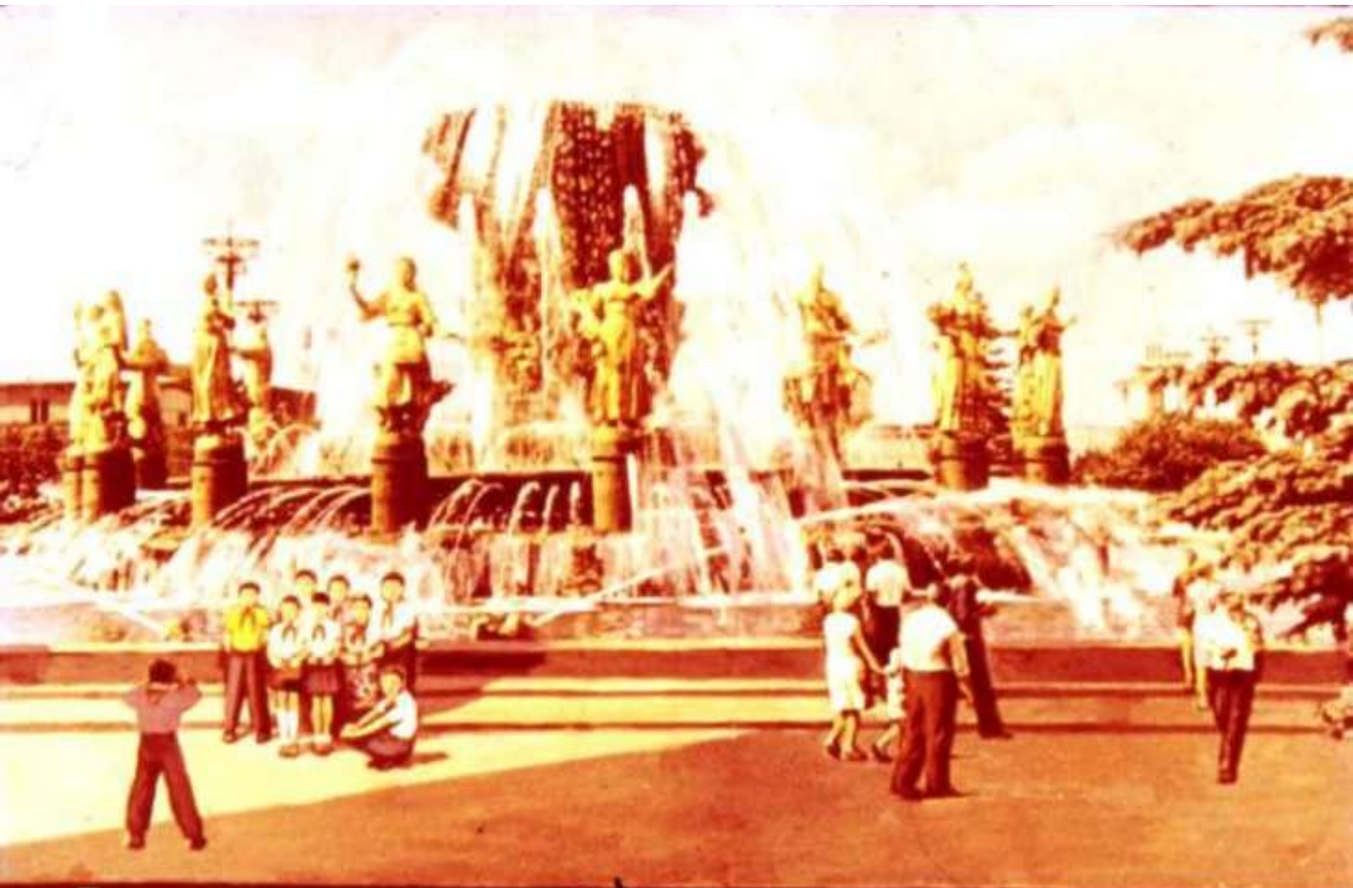
Долго ходили ребята по ВДНХ, осматривали павильоны республик, сфотографировались у фонтана «Дружба народов». 36