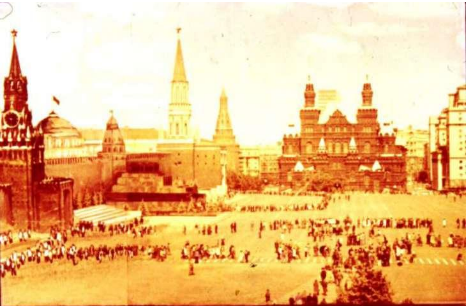
Ребятам больше всего хотелось посмотреть Красную площадь, Кремль.