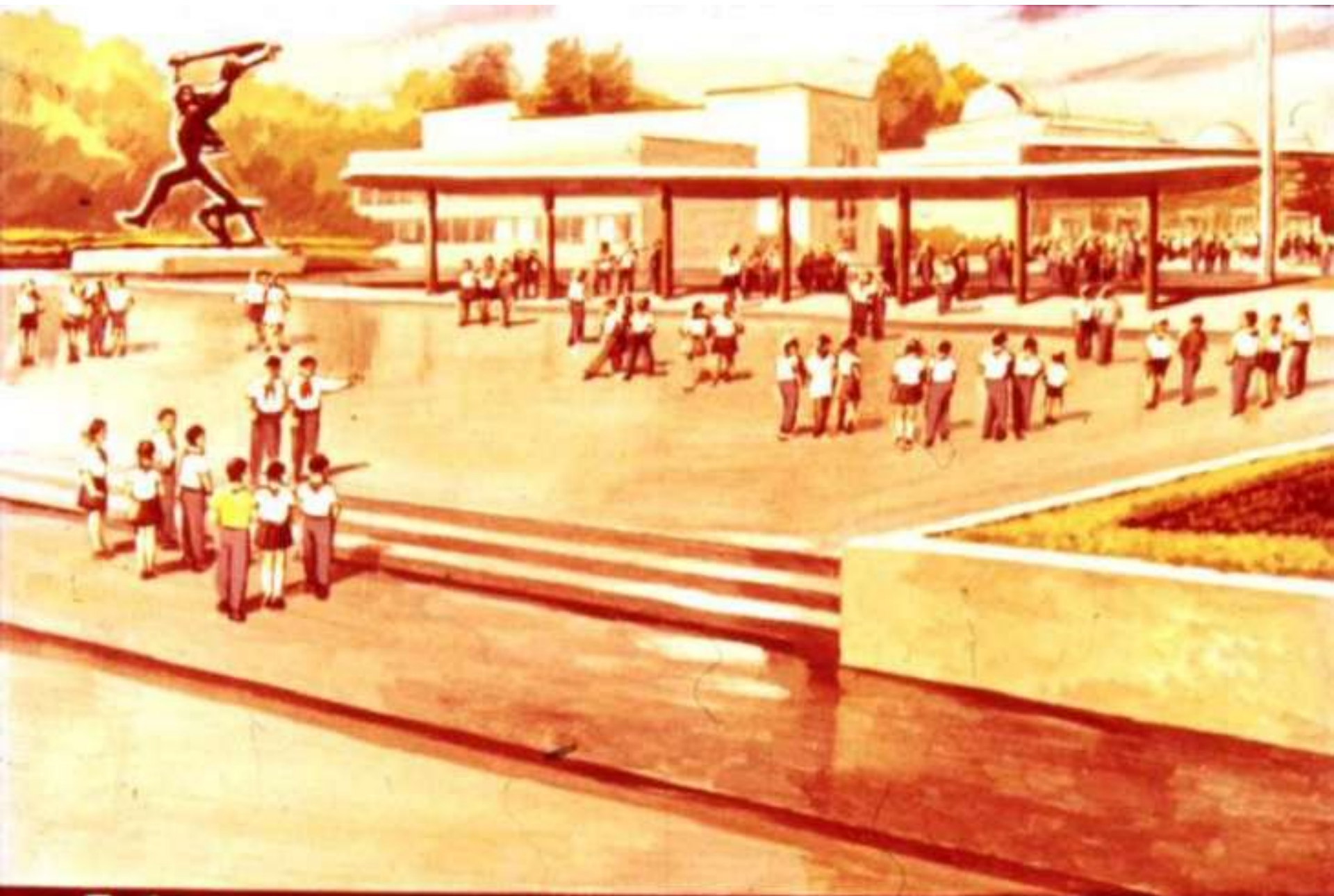
Побывали гости и во Дворце пионеров на Ленинских горах. 39