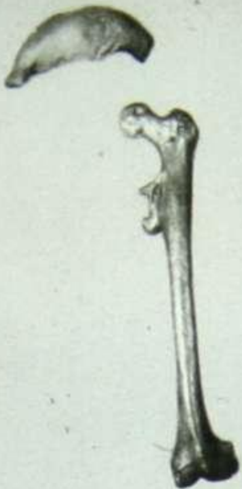
Черепная крышка и бедренная кость питекантропа.