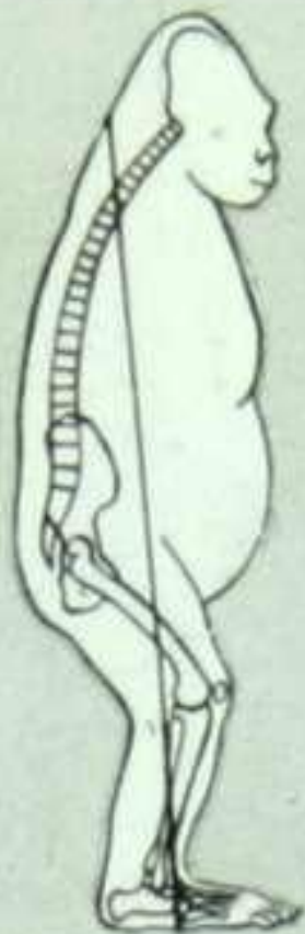
Человекообразная обезьяна горилла.