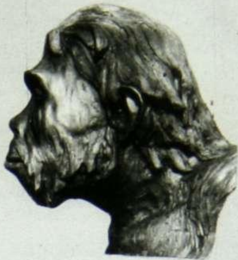
Синантроп (реконструкция М. М. Герасимова).