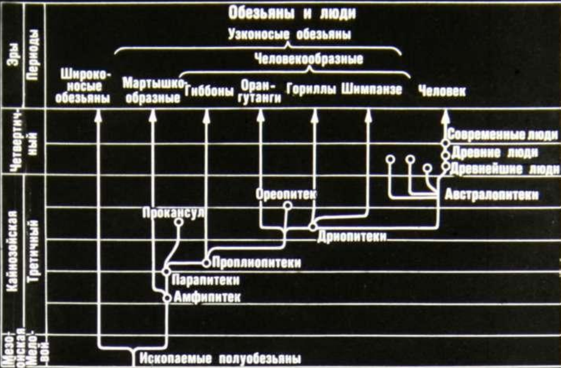
Схема родословной человека и обезьян.