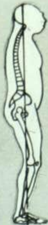
Древний человек — неандерталец.