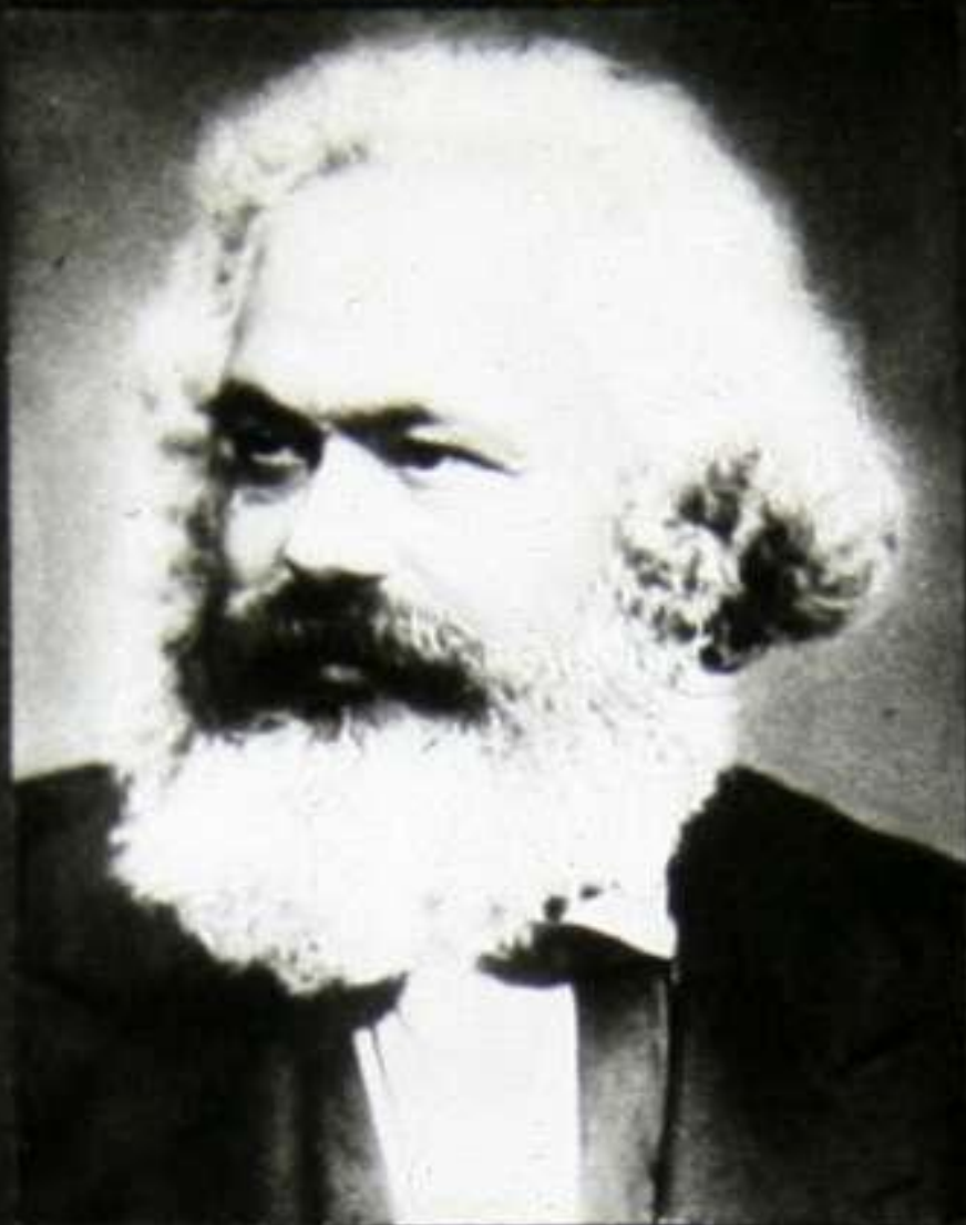
05.05.2018 К. Маркс (1818 – 1883 гг.).

Карл Маркс указывал, что человек „есть животное, делающее орудия“.