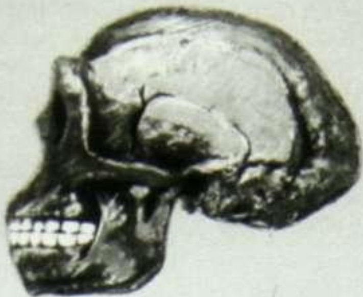
Череп синантропа (реконструкция Ф. Вейденрейха).