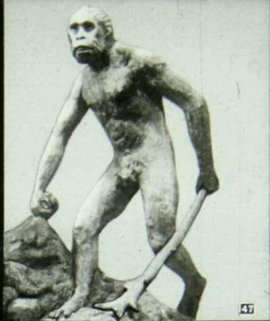
Питекантроп (реконструкция В. А. Ватагина).

Древнейший человек – питекантроп (обезьяночеловек) составляет промежуточное звено между обезьяной и древним человеком. Форма бедра питекантропа показывает, что он ходил на двух ногах.