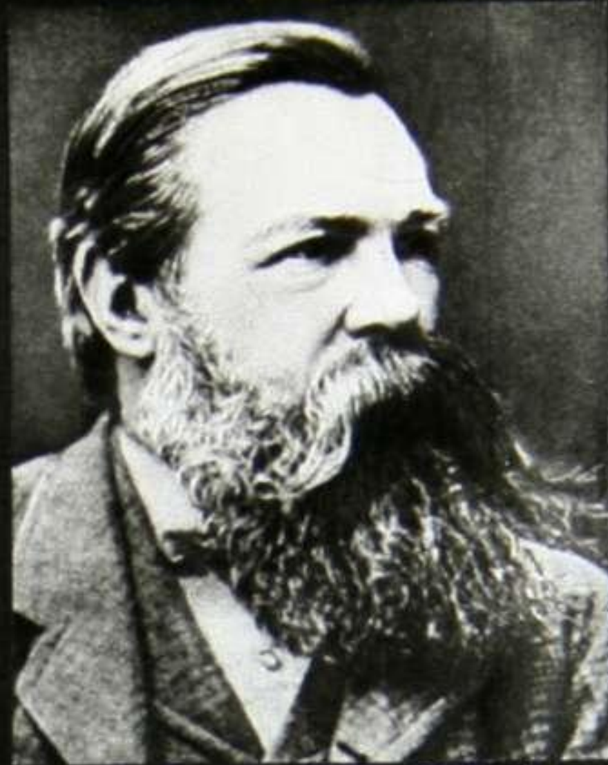
Ф. Энгельс (1820 – 1895 гг.).

„Труд начинается с изготовления орудий“, — писал Фридрих Энгельс.