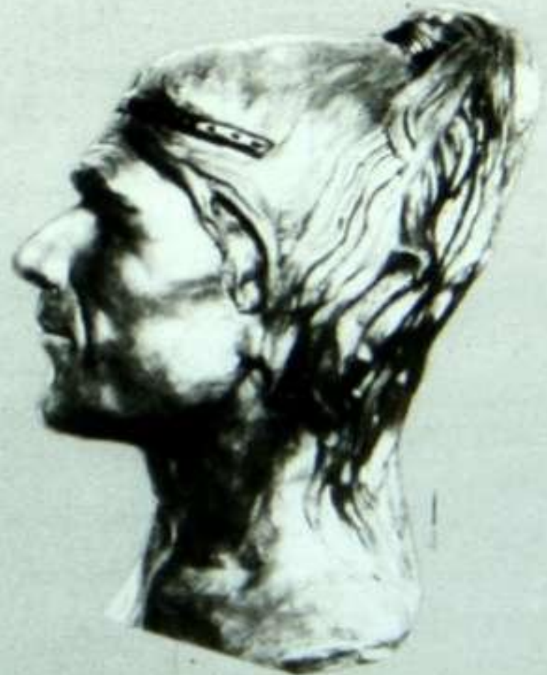
Кроманьонец (реконструкция М. М. Герасимова).