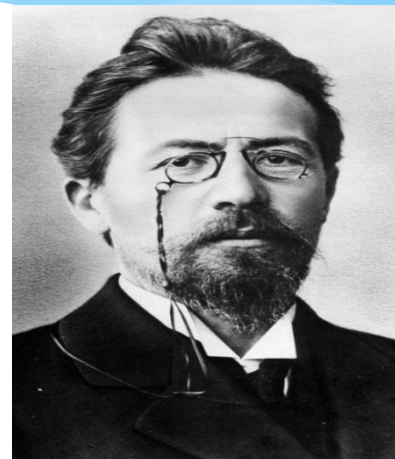
А. П. Чехов