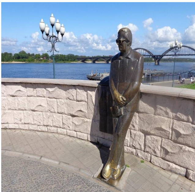
ПАМЯТНИК ПОЭТУ ЛЬВУ ОШАНИНУ