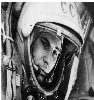
Ю. А. Гагарин.