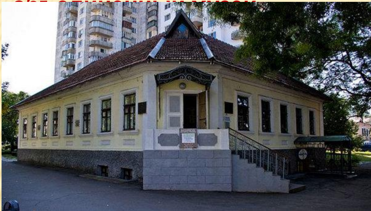
Штаб-музей Г. И. Котовского