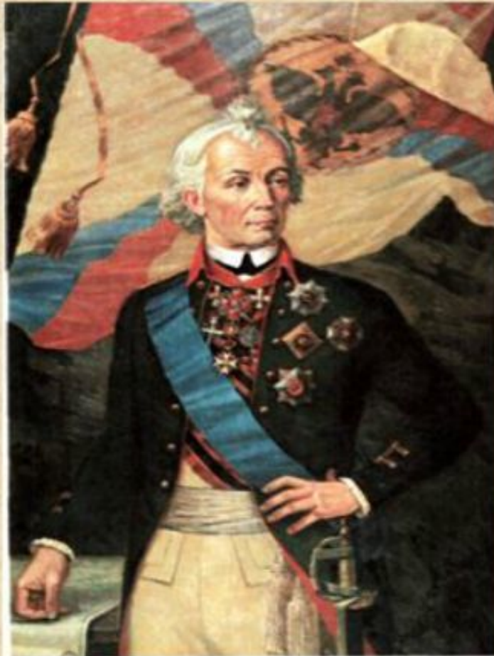
А.В. СУВОРОВ Художник А. Семенов.