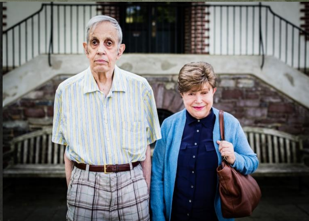
Джон и Алисия Нэш