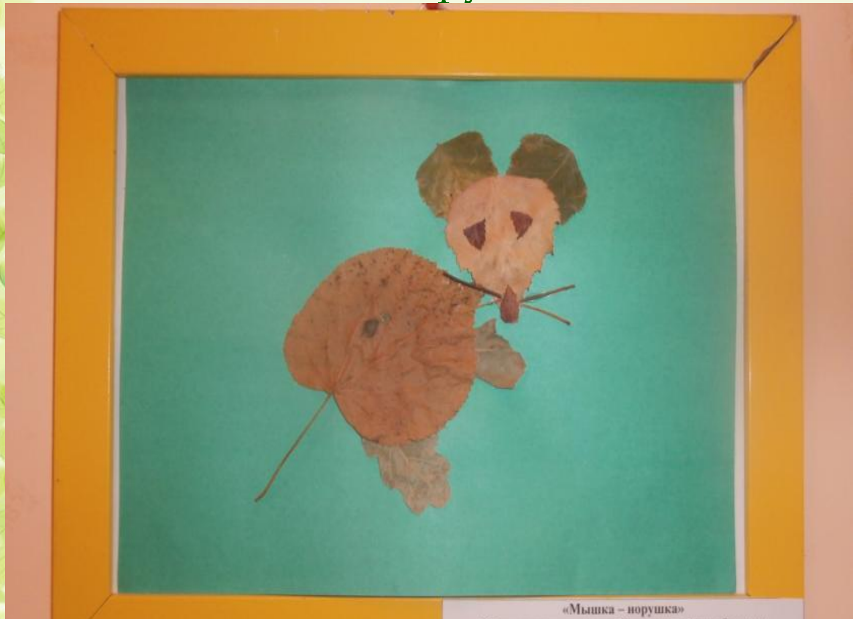
«Мышка – порушка»