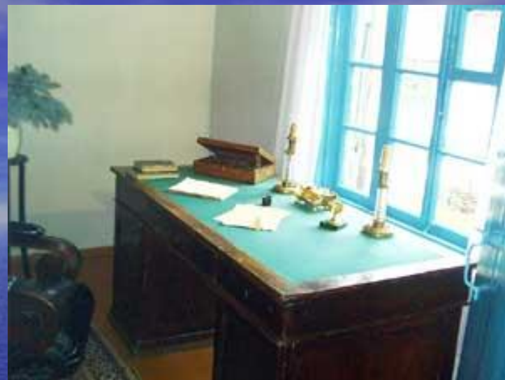
Стол и кресло Лермонтова