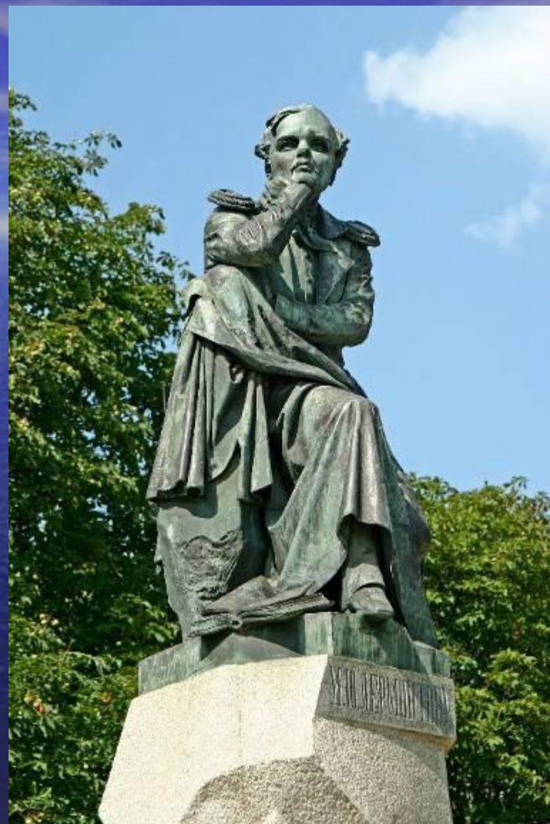
Это первый в России памятник М. Ю. Лермонтову,