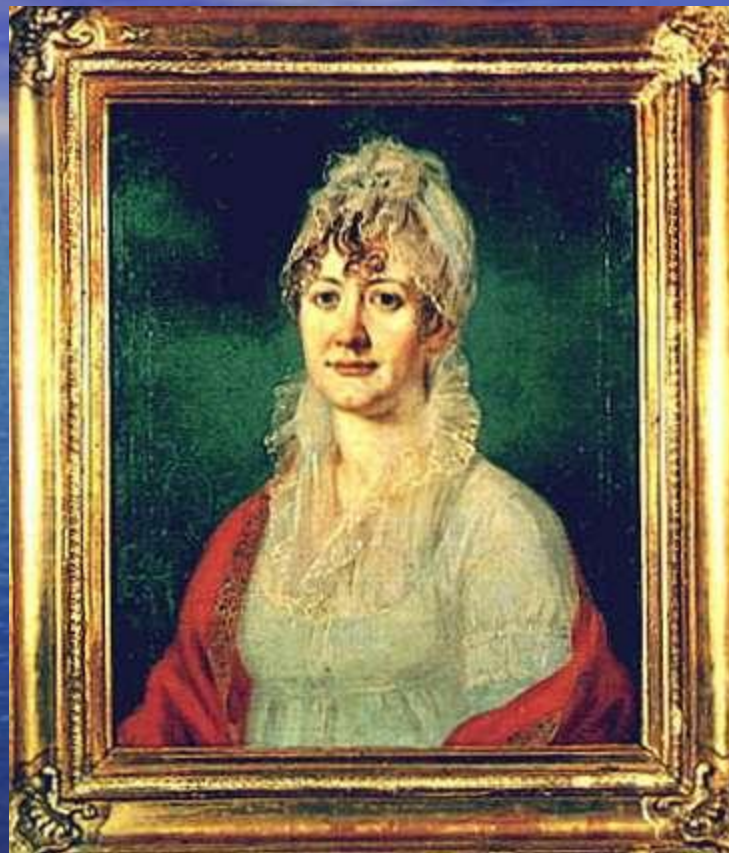
Портрет неизвестного художника. Масло. Начало XIX в.