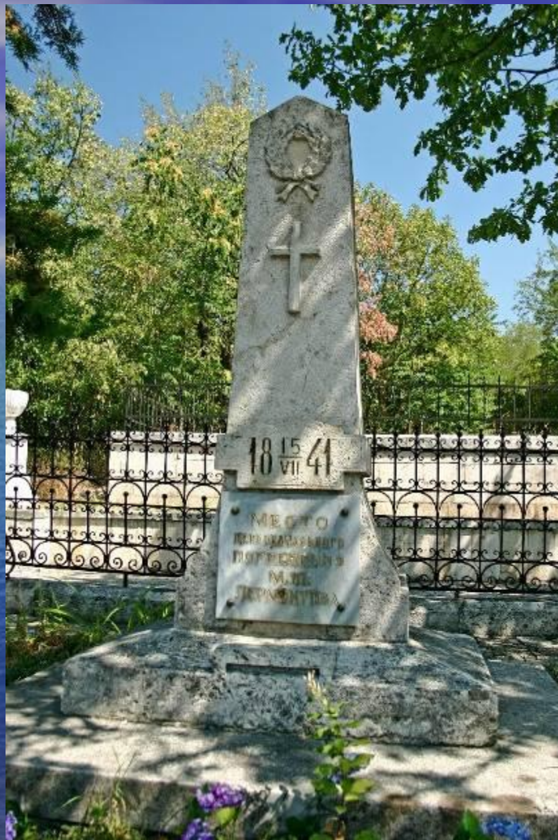
Место первоначального погребения Лермонтова в Пятигорске