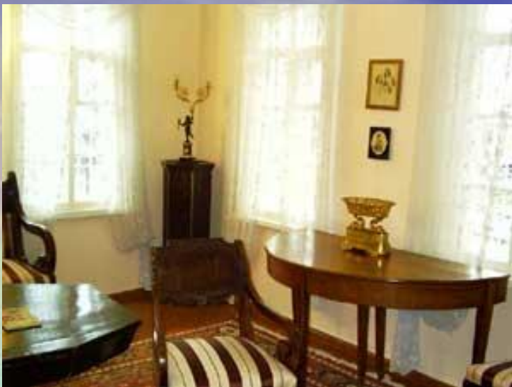
В этой комнате был вызван на дуэль Лермонтов