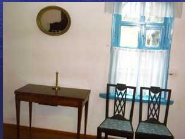
Лермонтовская половина дома