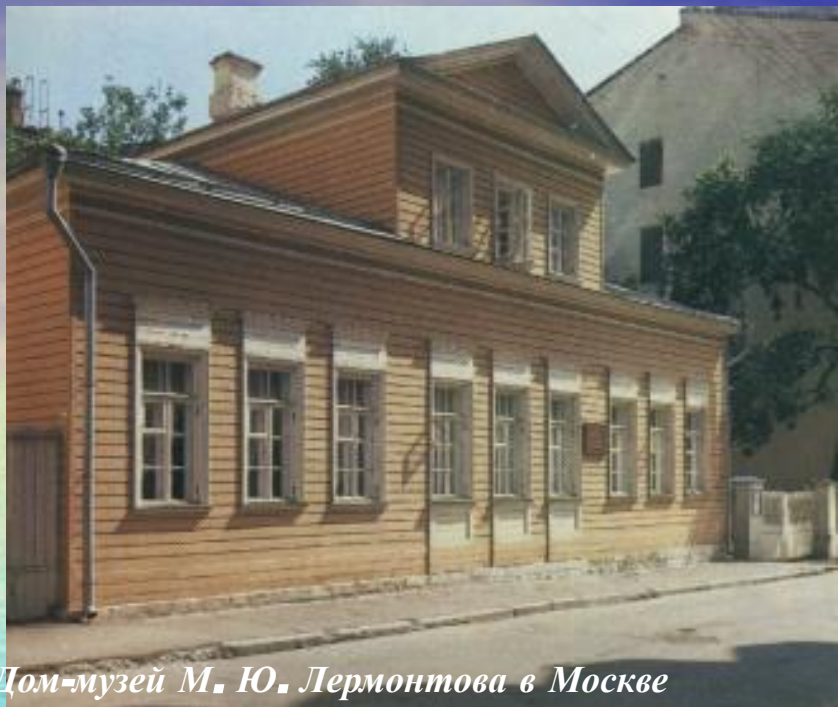
Дом-музей М. Ю. Лермонтова в Москве