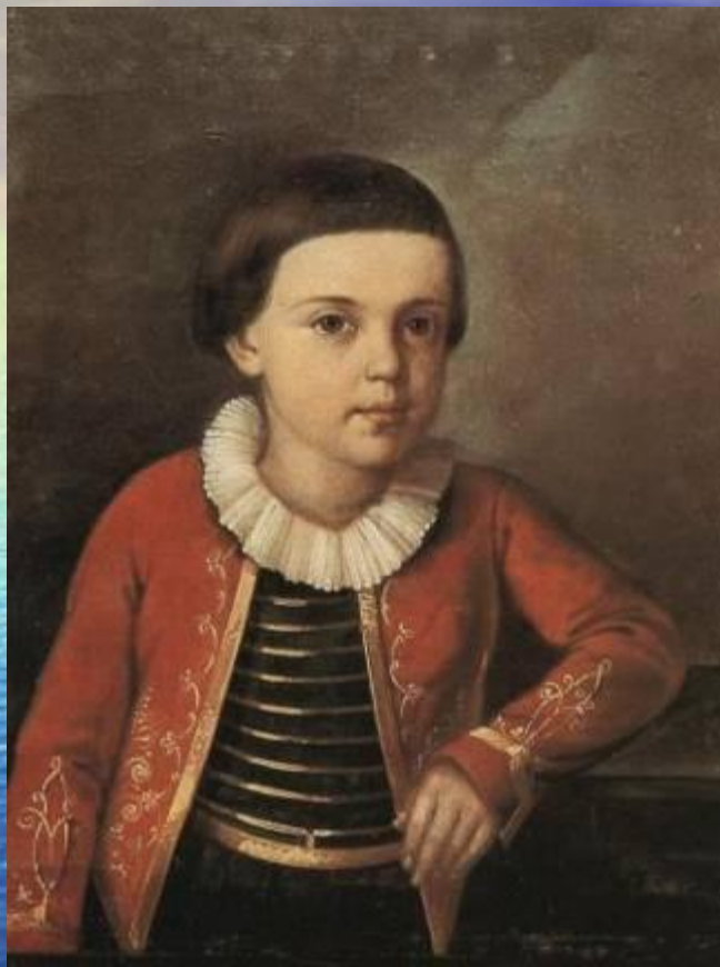
М. Ю. Лермонтов в детстве.