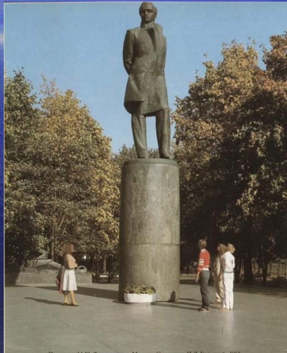
Памятник М.Ю. Лермонтову в Москве. Скульптор И.Д. Бродский. 1965