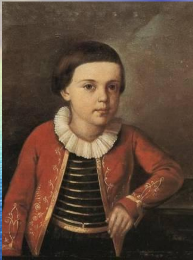
М. Ю. Лермонтов в детстве.