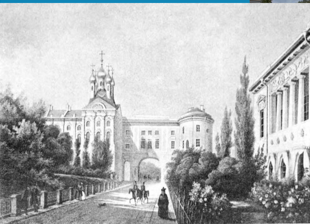
ЛИЦЕЙ И ДИРЕКТОРСКИЙ ДОМЪ.