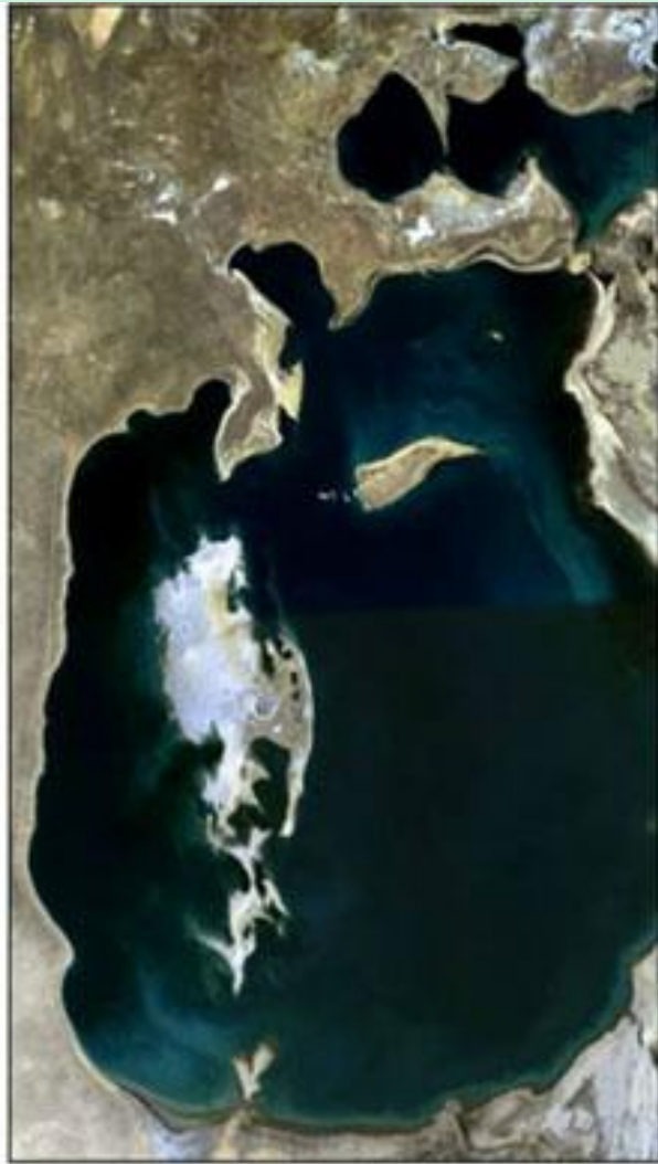
July – September, 1989