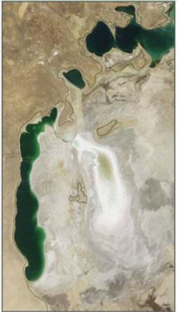
August 16, 2009