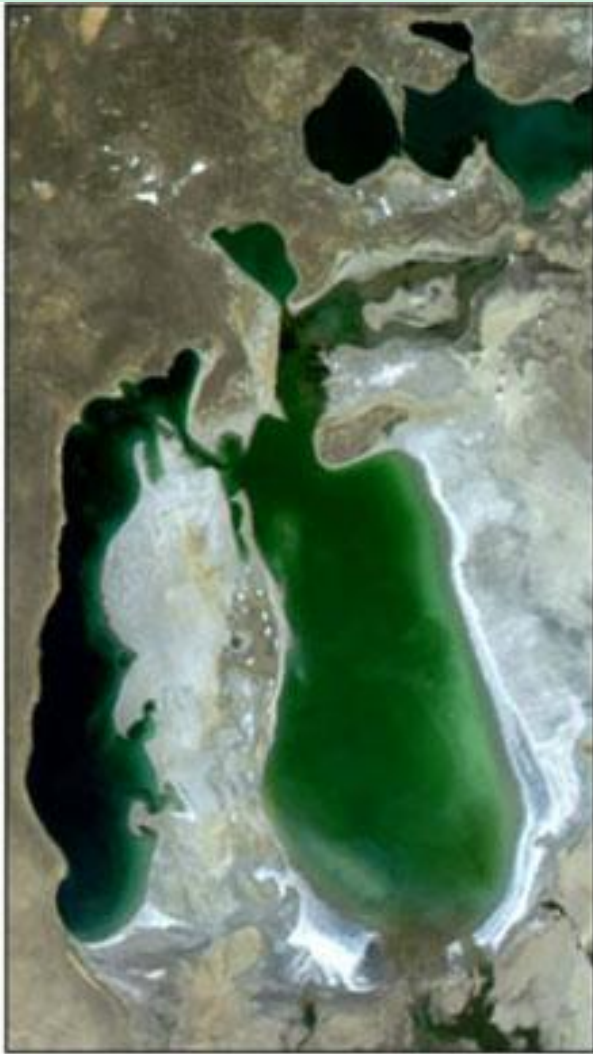
August 12, 2003