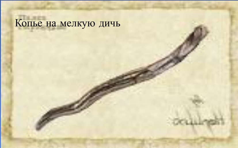
Копье на мелкую дичь