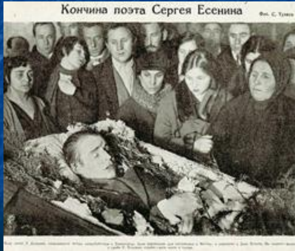
Кончина поэта Сергея Есенина

14 декабря 1925 года Сергей Александрович Есенин закончил работать над поэмой "Чёрный человек", над которой трудился 2 года. Эта поэма была напечатана уже после смерти поэта. 23 декабря этого же года Есенин приехал в Ленинград и остановился в гостинице "Англетер". 27 декабря он напечатал своё последнее в жизни стихотворение "До свидания, друг мой, до свидания" и в ночь с 27 на 28 декабря Сергей Есенин ушёл из жизни. В наше время спорят о том, было ли это самоубийство или смерть от рук наемных убийц.