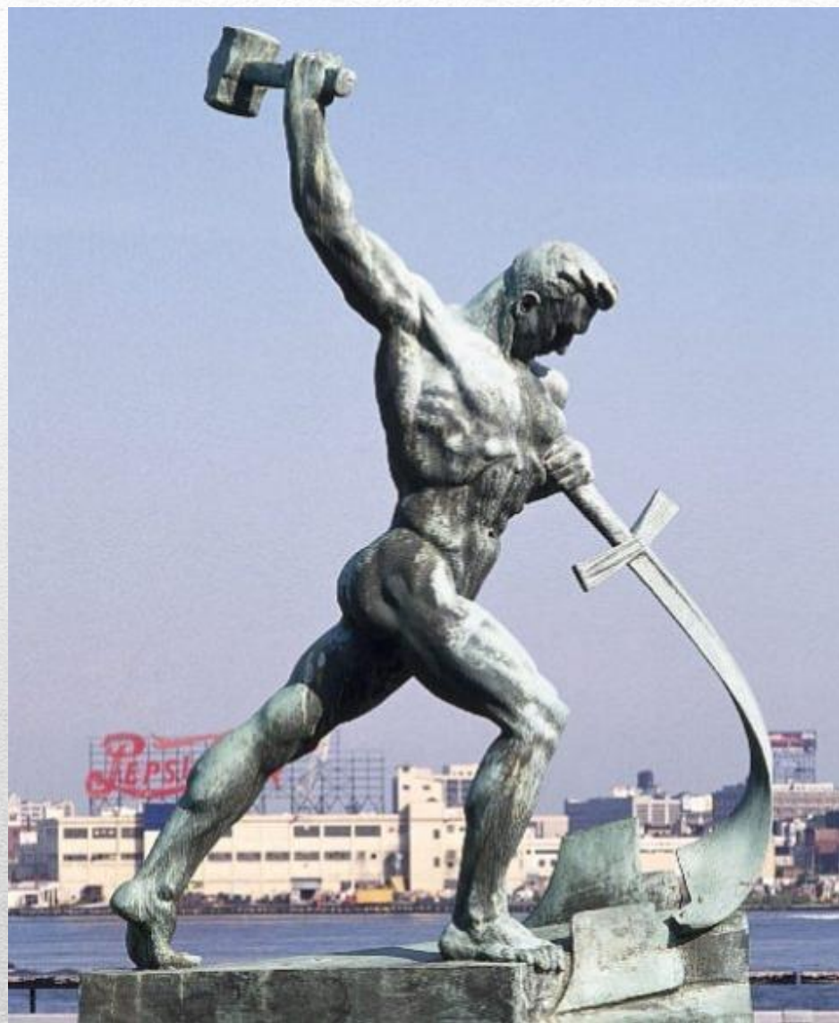
«Перекуём мечи на орала» 1957 год.

Вучетич становится автором аллегорической статуи «Перекуём мечи на орала», установленной у здания ООН в Нью-Йорке (США). Её копия сейчас находится недалеко от филиала ГТГ на Крымском валу в Москве.