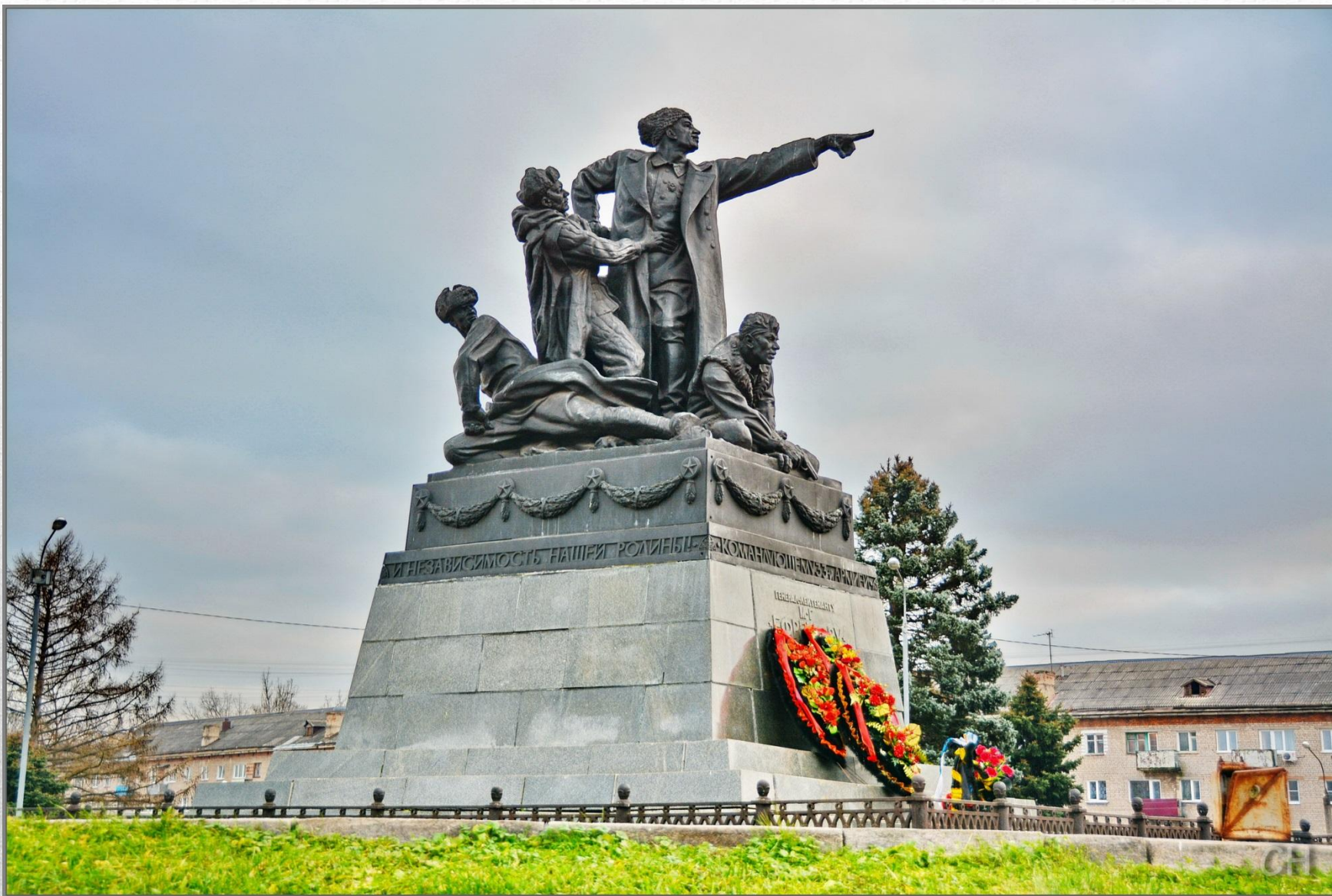
Памятник генерал-лейтенанту М. Г. Ефремову