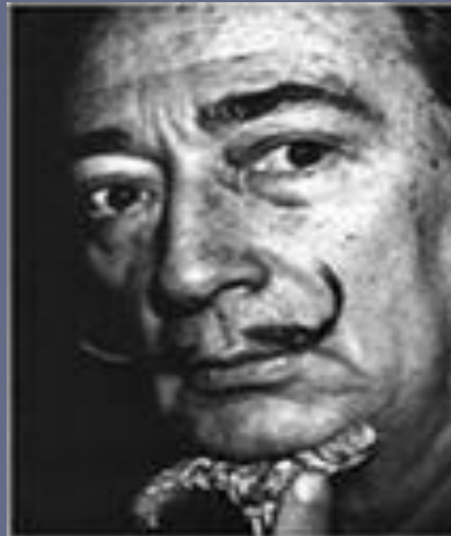
Художник Сальвадор Далі