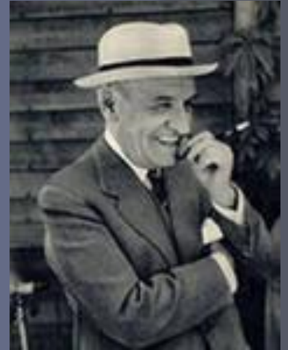
Філософ Хосе Ортега – і - Гасет