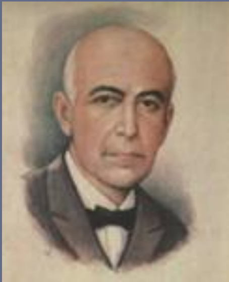
Композитор Мануель де Фалья