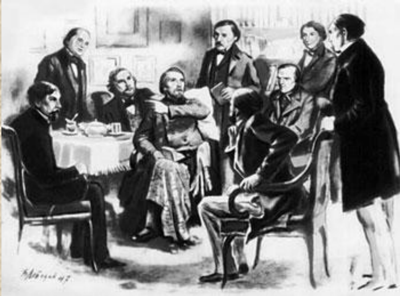
Петербургский кружок литераторов вокруг В.Г. Белинского.