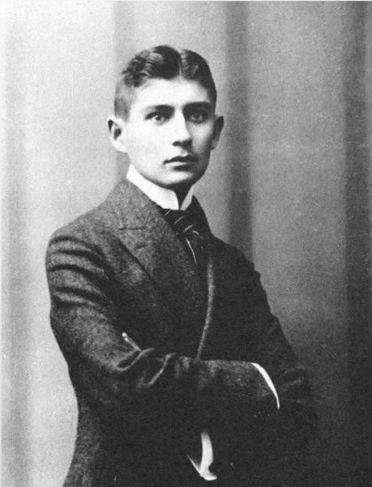
Австрийский писатель Франц Кафка завещал после его смерти сжечь все его произведения.