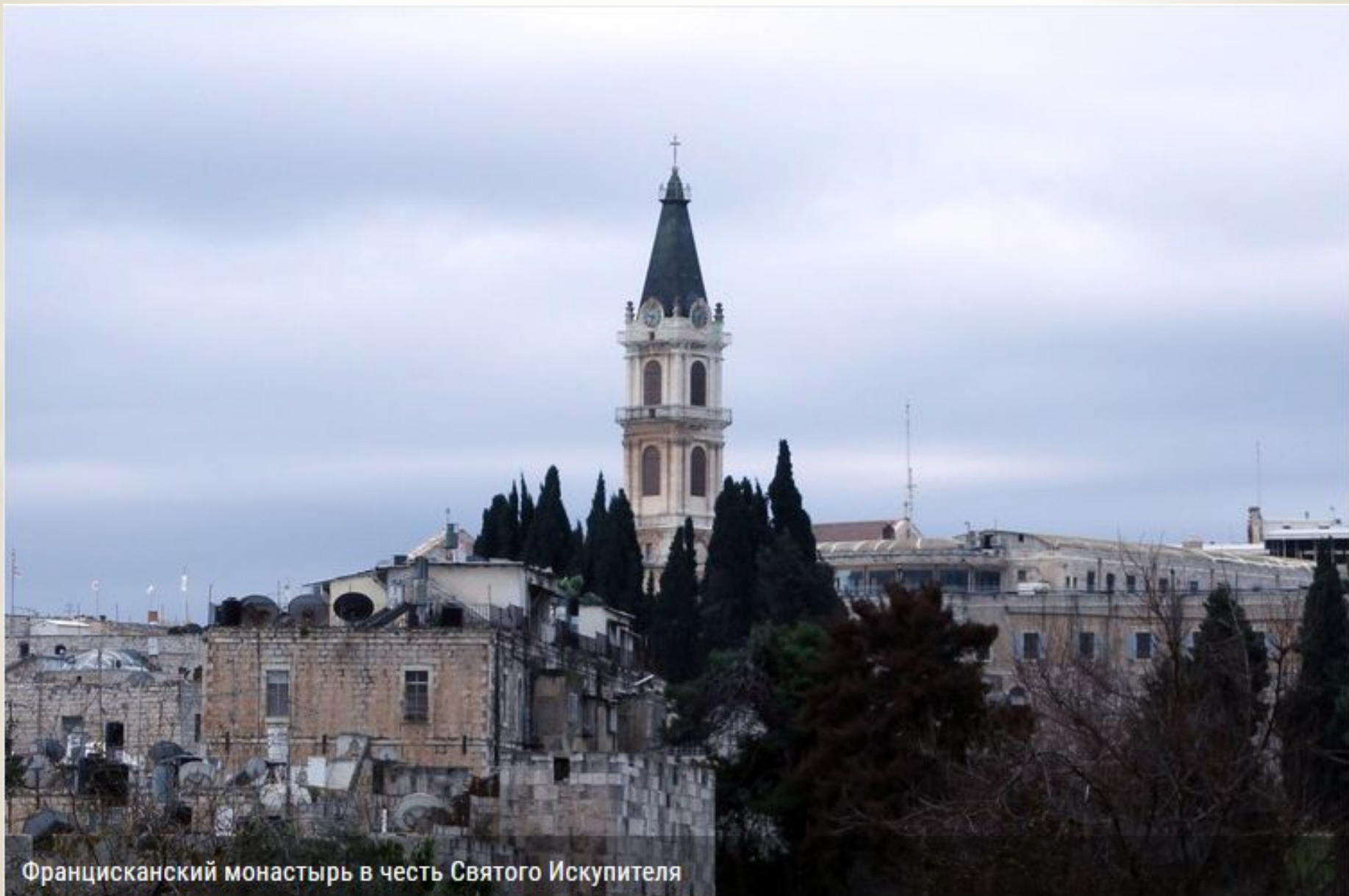
Францисканский монастырь в честь Святого Искупителя