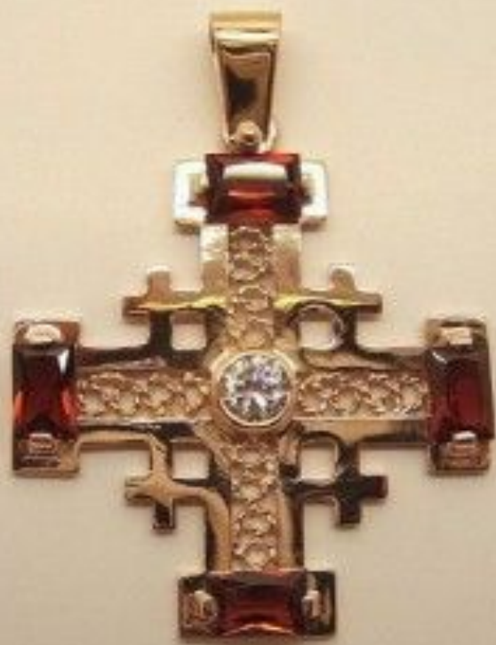
Орден Святой Земли