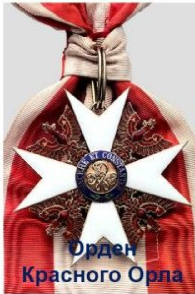
Орден Красного Орла