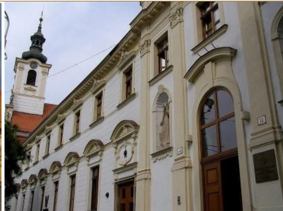
Францисканская церковь в Словакии