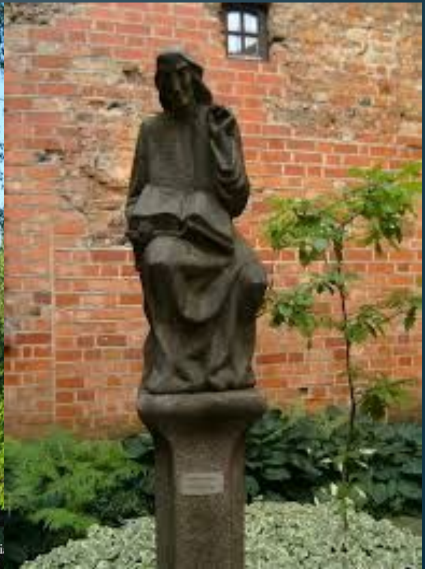
Помнік у Вільні.