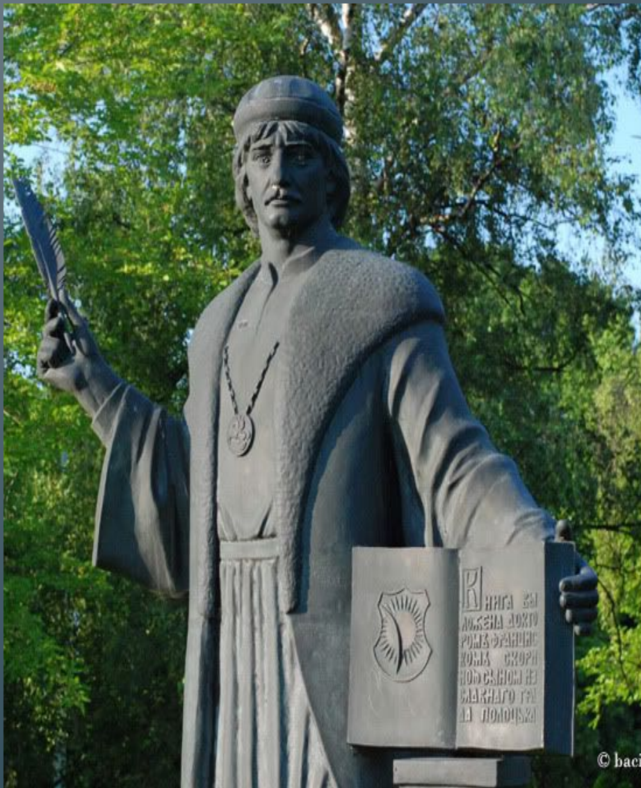
• Помнік у Празе.