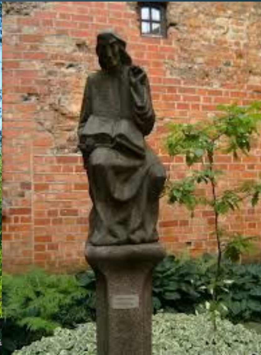
Помнік у Вільні.