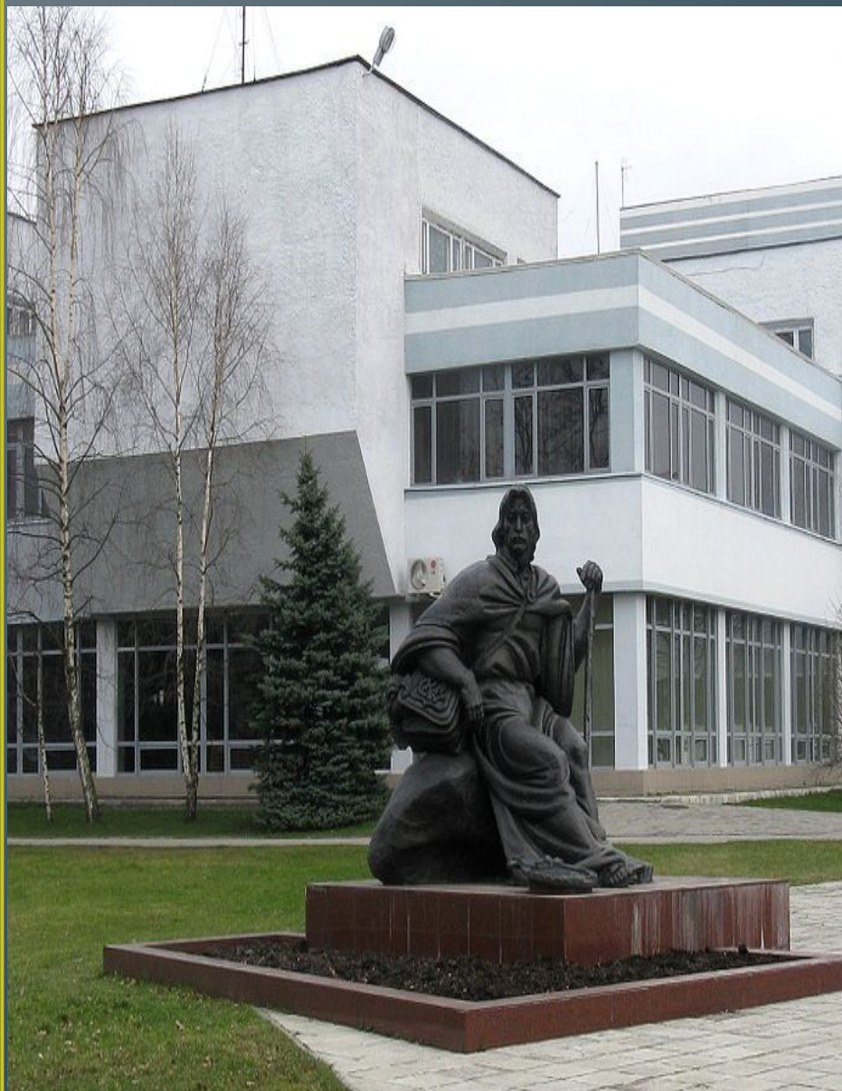
• Помнік у Калінінградзе.