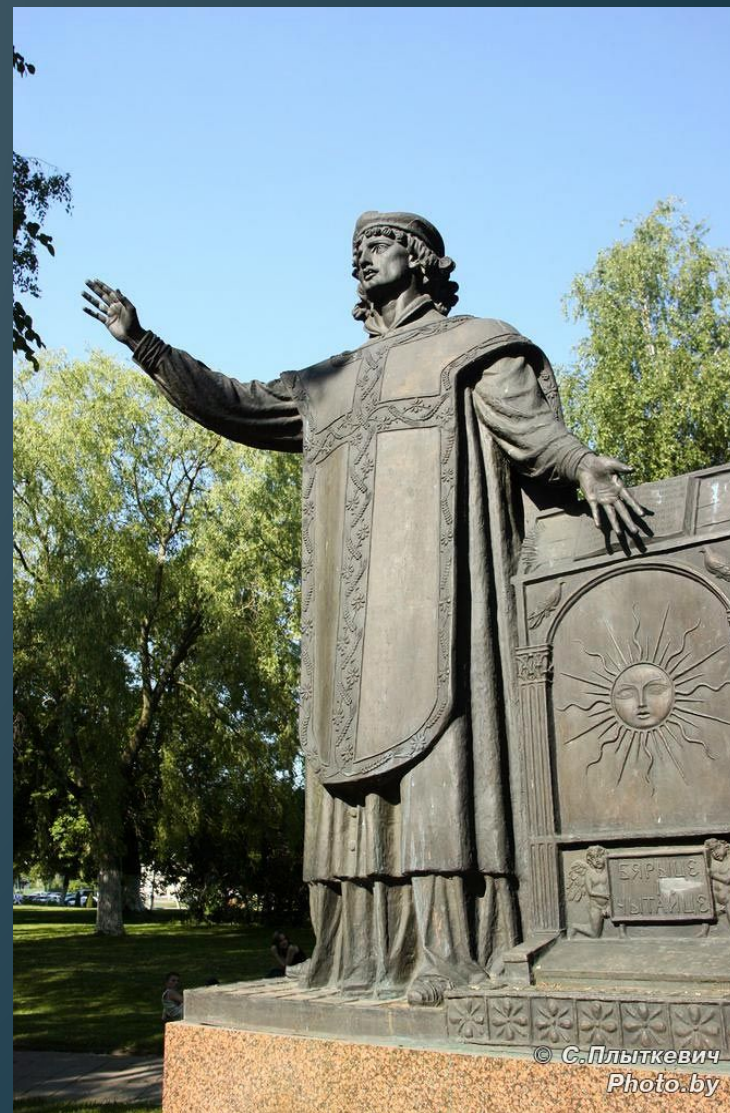
Помнік у Лідзе.