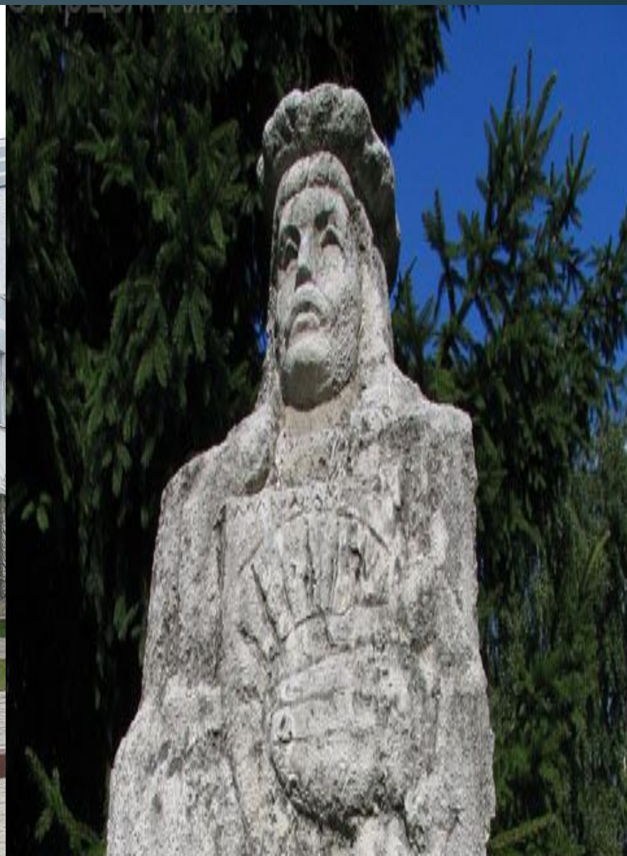
Помнік У Купалаўскім скверы