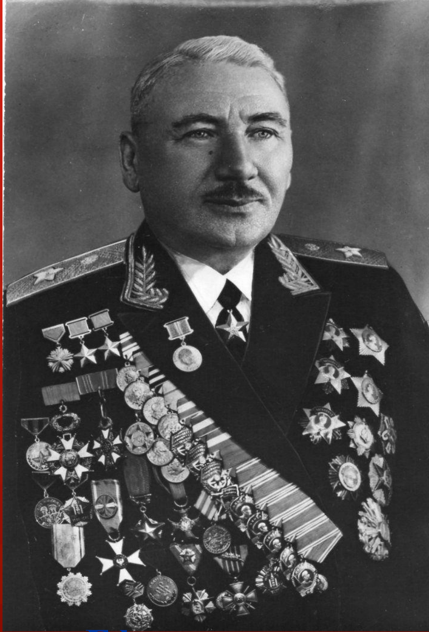
Афсады инæлар Плиты Иссае