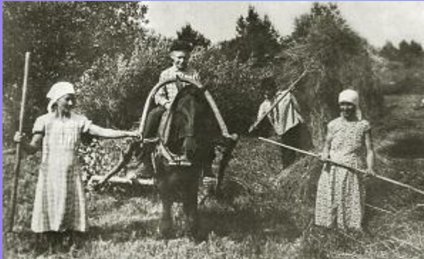
Крестьянская страда на Севере