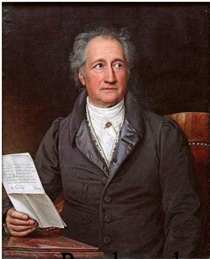
Иоганн Вольфганг фон Гёте

В столице Баварии Тютчев не только изучал романтическую поэзию и немецкую философию, но и переводил на русский язык произведения Фридриха Шиллера и Иоганна Гете. Собственные стихи Федор Иванович публиковал в российском журнале «Галатей» и альманахе «Северная лира».