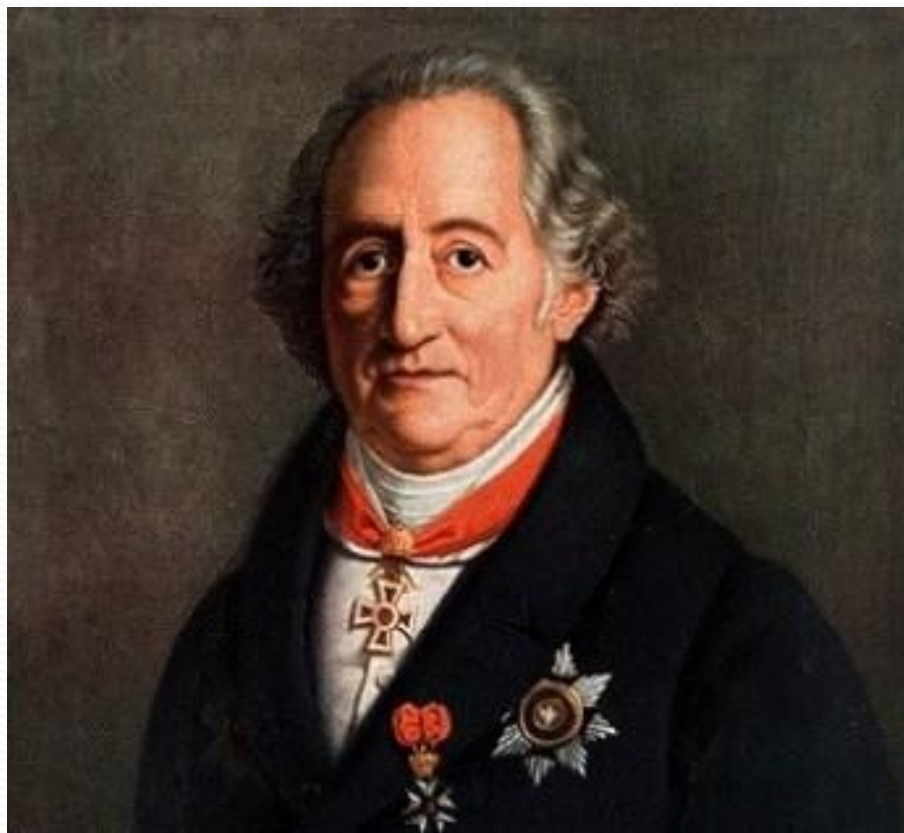
Иоганн Вольфганг фон Гёте

Тютчев, как поэт, многое воспринял от немецкой культуры. Любовь к поэзии и философии Гёте, знакомство с Гейне и Шилленгом оказали влияние на взгляды и творчество Ф.И. Тютчева.