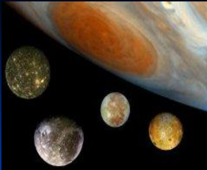
4 супутники Юпітера