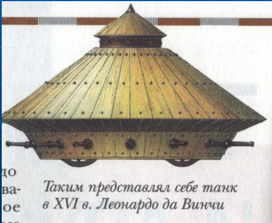
до ва- ое 18 Таким представлял себе танк в XVI в. Леонардо да Винчи

Танк – это боевая гусеничная машина высокой проходимости с мощным оружием и надёжной защитой от противотанковых средств противника.