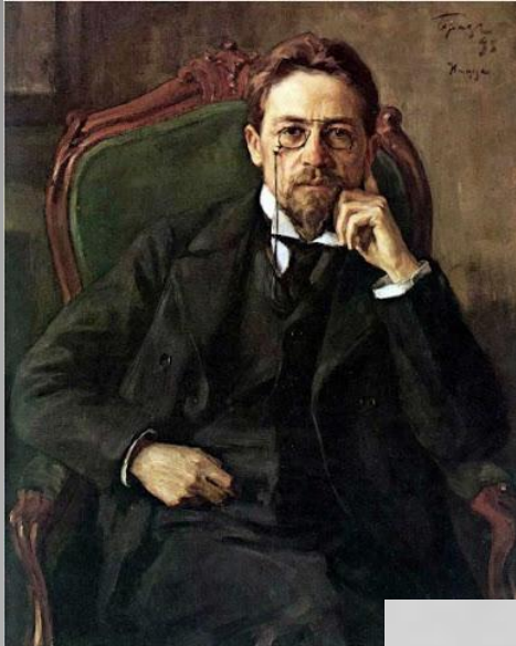
И. Э. Браз. Портрет А. П. Чехова. 1889