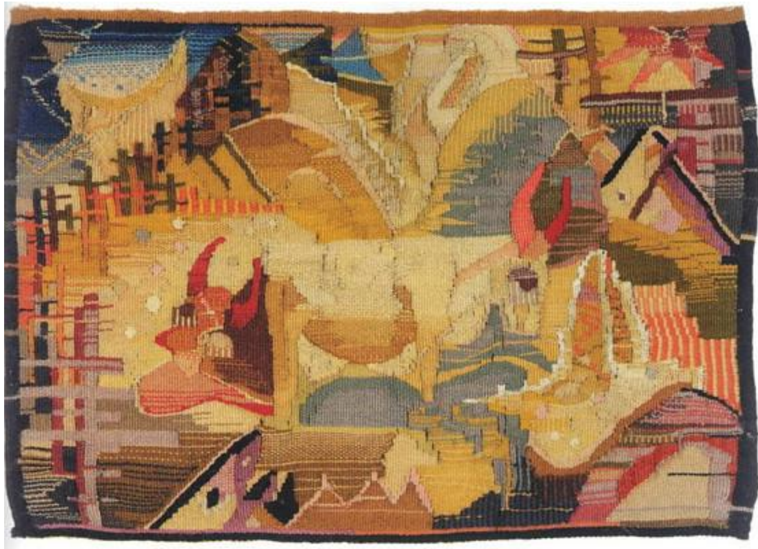
Коровы на природе