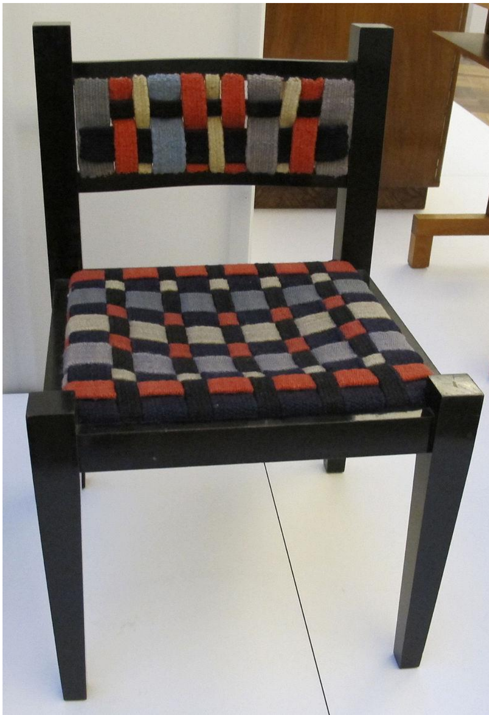
Текстиль Гунты Штольц на стуле Марселя Брейера (1922)