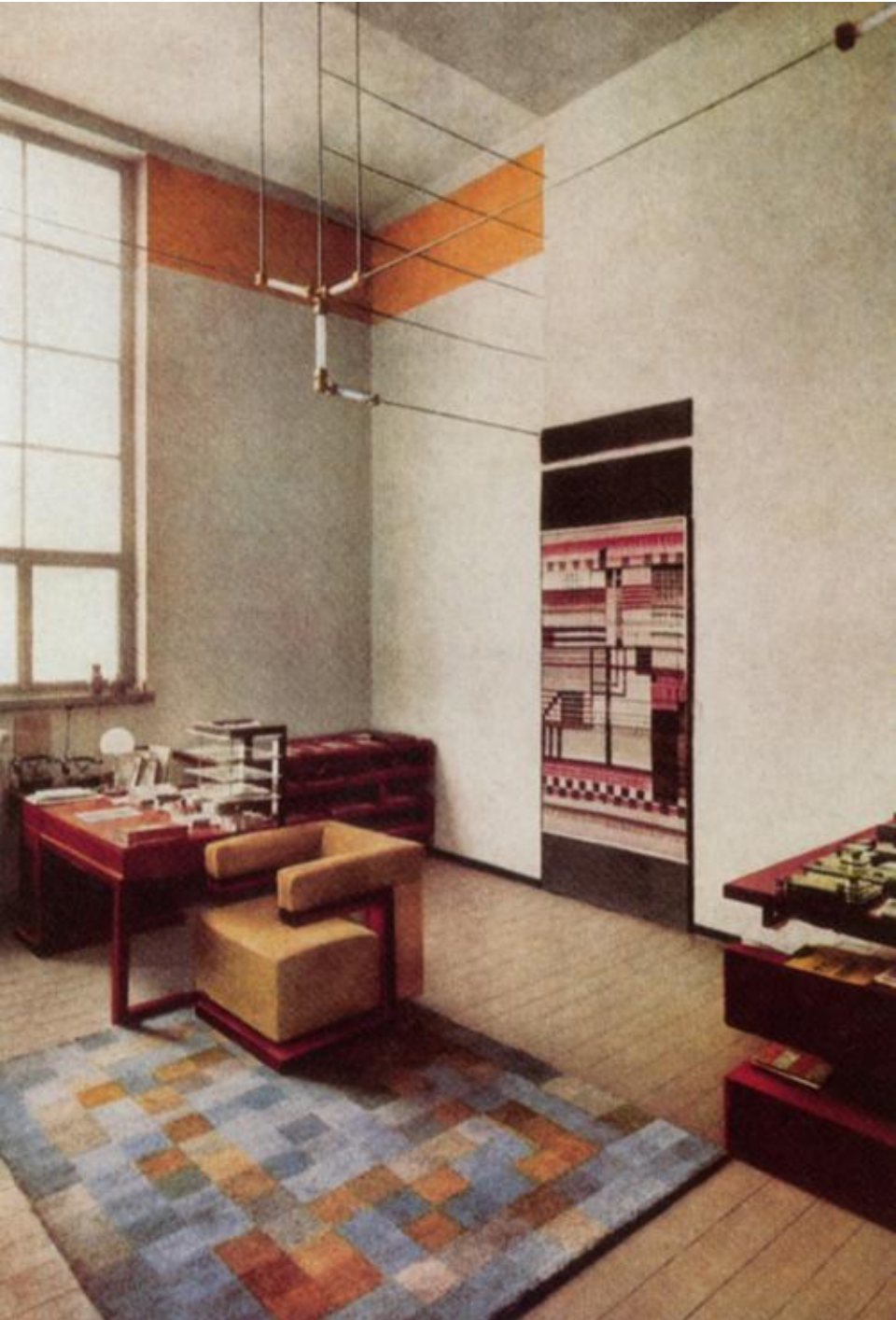
Кабинет Вальтера Гропиуса