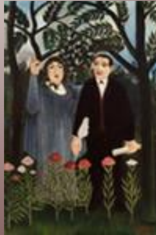
Художник Анрі Руссо. Гійом Аполлінер і його муза.

У Парижі письменнику жилося важко, він перебивався випадковими заробітками, нарешті влаштувався вчителем у заможну родину і виїхав з нею за кордон. Нові враження сприяли виявленню художнього таланту Г. Аполлінера – цим псевдонімом з 1902 р. він став підписувати свої поезії.