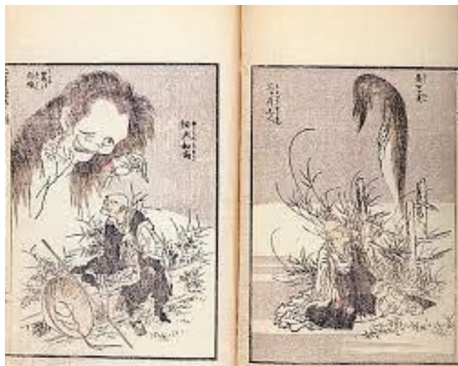
Записки скучного человека