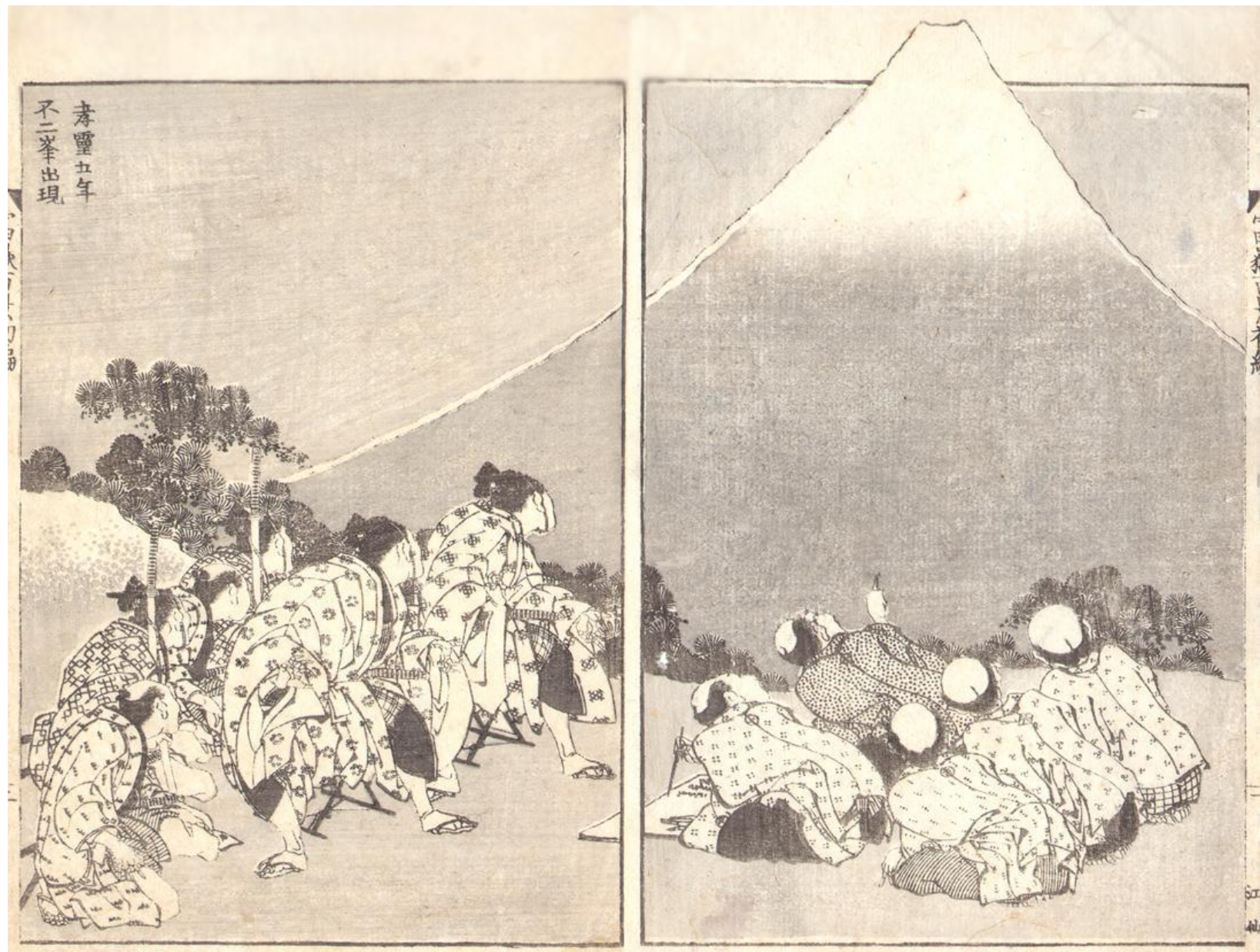
Созерцание горы Фудзи. 1814