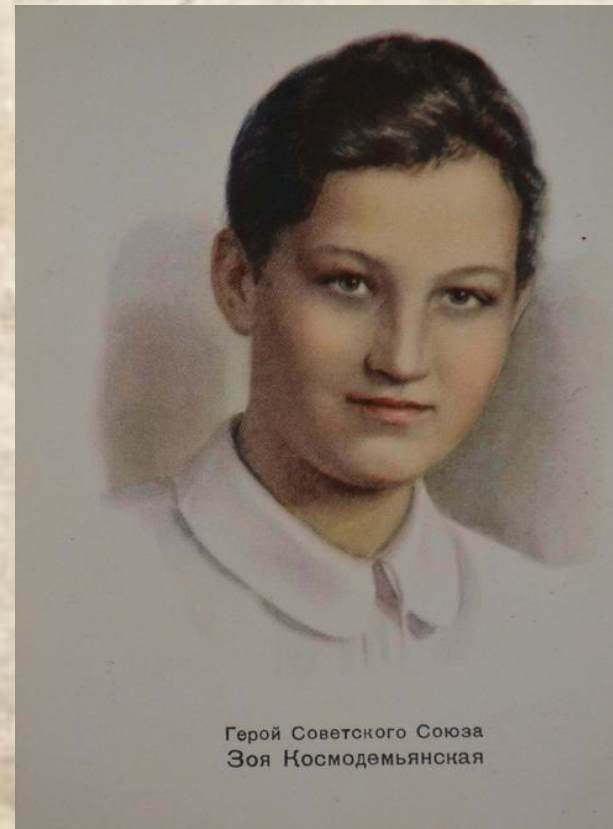
Герой Советского Союза Зоя Космодемьянская