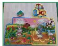
Книга с пазлами