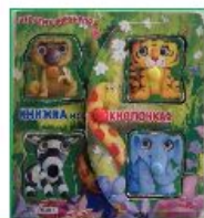
Книжка на кнопках