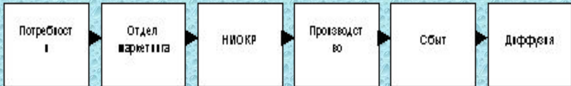
Рис. 1. Первая и вторая модели инновационного процесса

Вторая модель инновационного процесса: подтягиваемая спросом