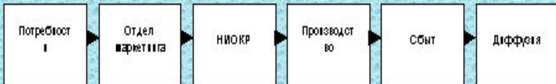
Рис. 1. Первая и вторая модели инновационного процесса

Вторая модель инновационного процесса: подтягиваемая спросом