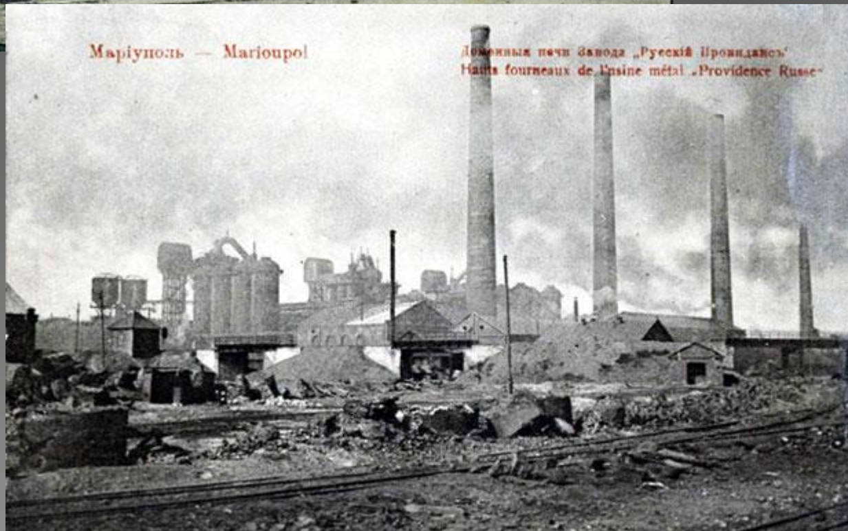
Мариуполь — Marioupol

Второй металлургический гигант Мариуполя тех лет принадлежал бельгийской компании «Провиданс».