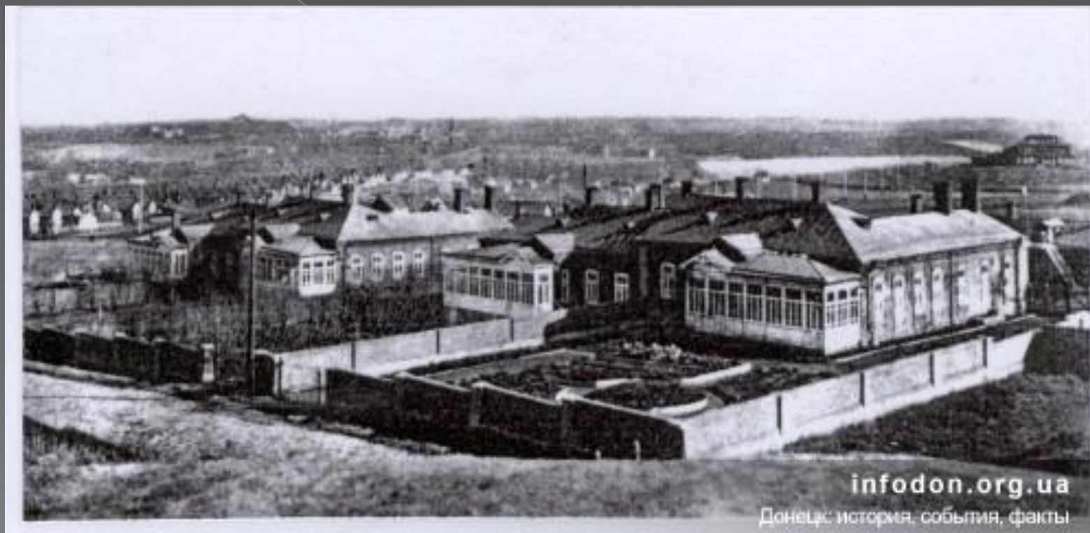
Дома английских специалистов. Так называемая Английская колония.

Летом 1870 года из Англии сюда было завезено оборудование и инструменты, а также приехали около сотни английских специалистов—инженеров, металлургов и шахтеров, усилиями которых к апрелю 1871 года им удалось построить первую доменную печь, а в 1872 году начать выплавку чугуна.