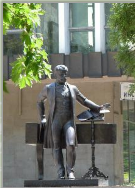
Памятник композитору Чайковскому, г. Симферополь