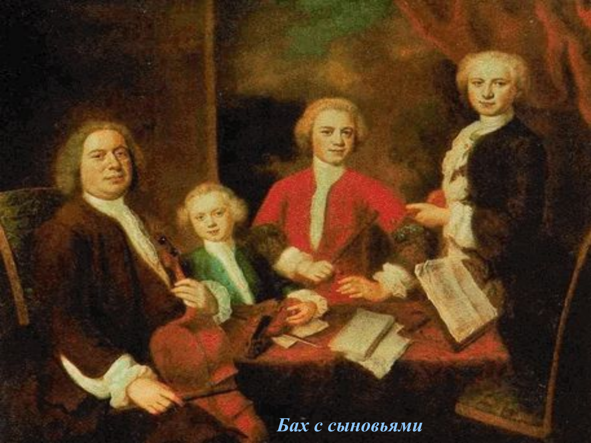
Бах с сыновьями