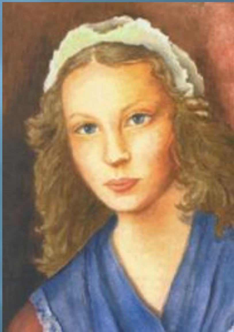
Анна Магдалена Бах (1701-1760)