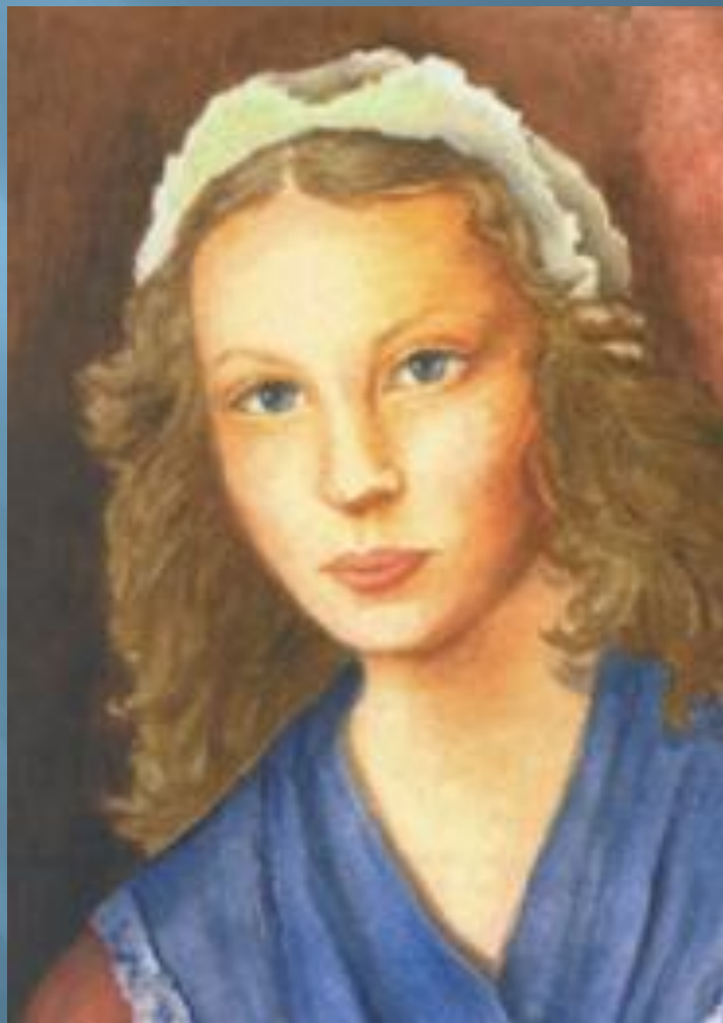
Анна Магдалена Бах (1701-1760)