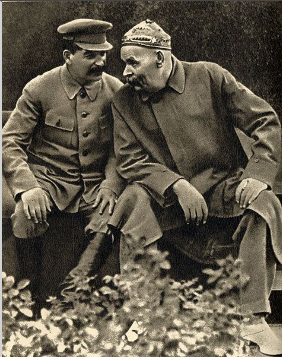
Иосиф Сталин и Максим Горький в скверике на Красной площади, 1931 год