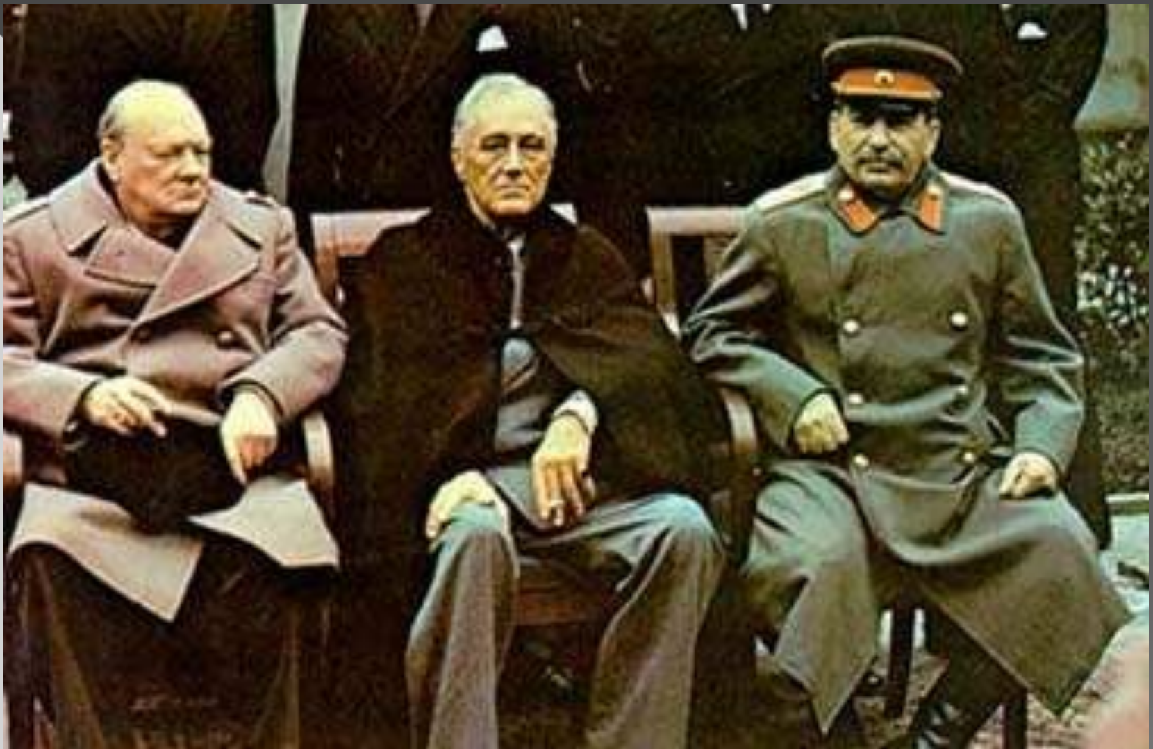
Черчилль, Рузвельт и Сталин на Ялтинской конференции.