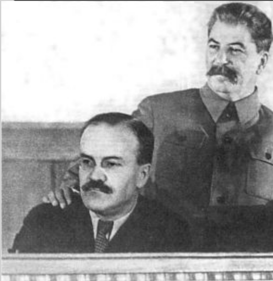
Молотов и Сталин