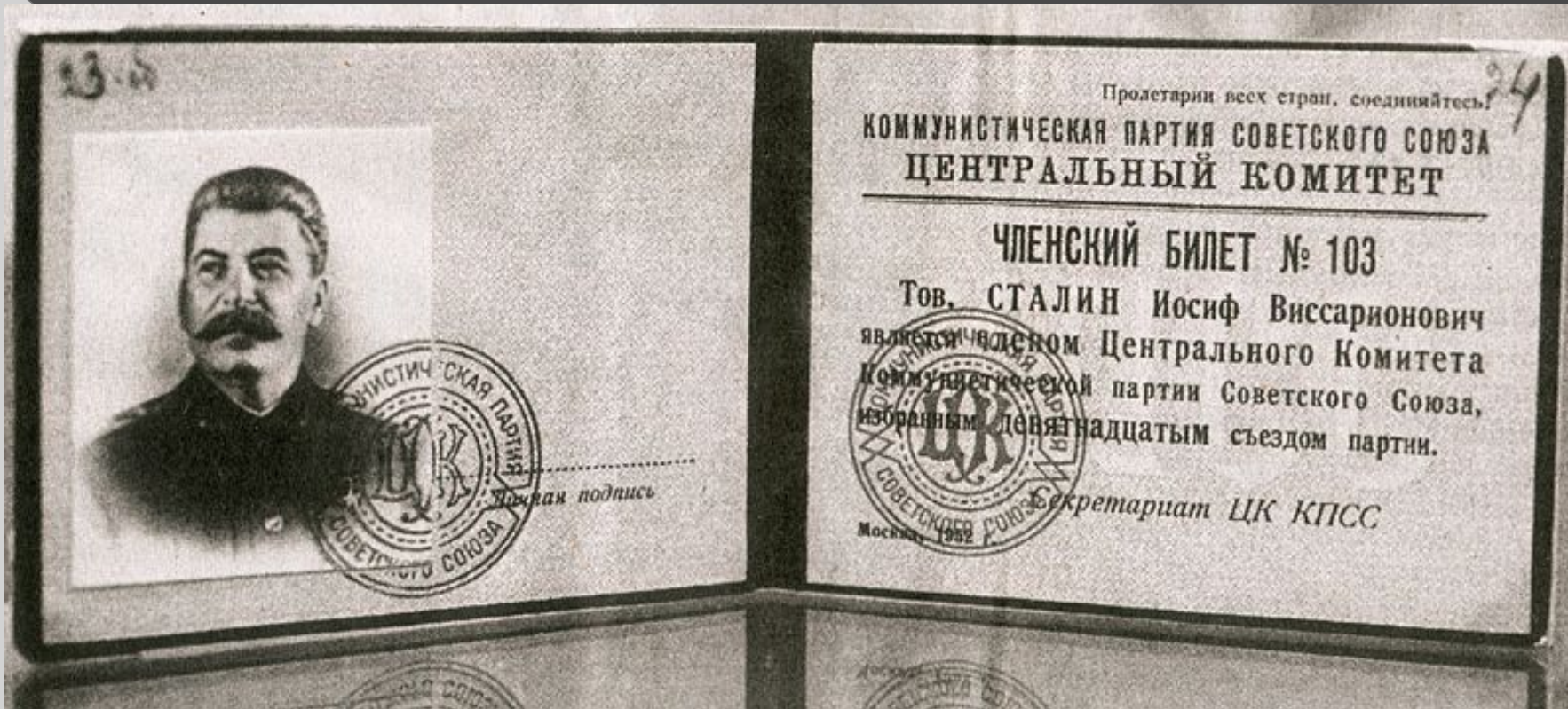
Билет члена ЦК КПСС № 103 И. В. Сталина. 1952