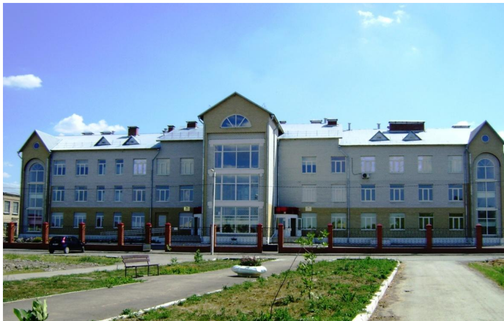
МОУ «СОШ №1 г. Ершова»