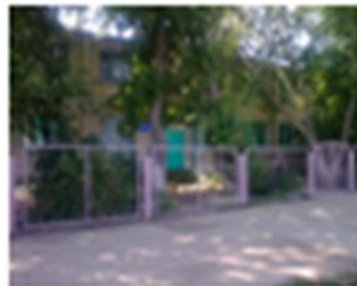
Филиал МОУ «СОШ №1 г. Ершова» в п. Южный