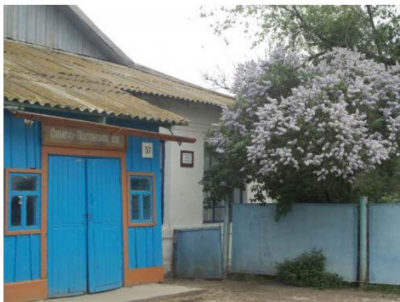
Филиал МОУ «СОШ №1 г. Ершова» в с. Семёно-Полтавка