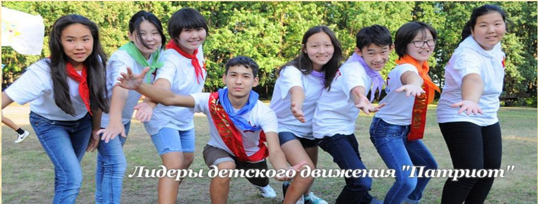
Лидеры детского движения "Патриот"