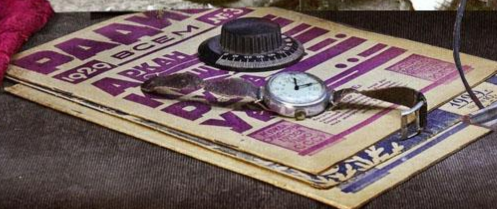
История одной фотографии