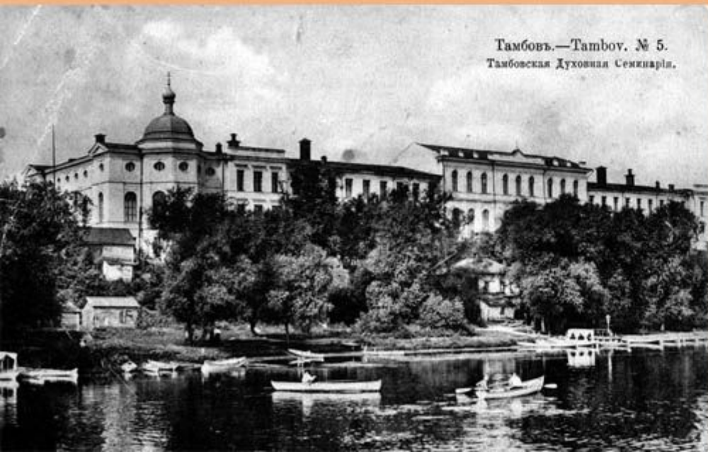
Тамбовь.—Tambov. № 5. Тамбовская Духовная Семинария.