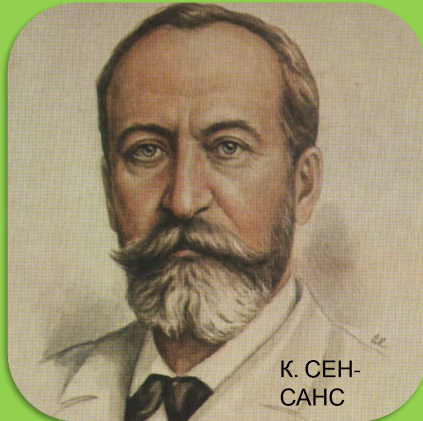
К. СЕН- САНС