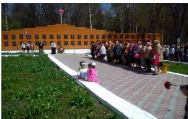
Московская область, Можайский район, деревня Мокрое Мемориальная стена памяти воинам павшим в годы ВОВ