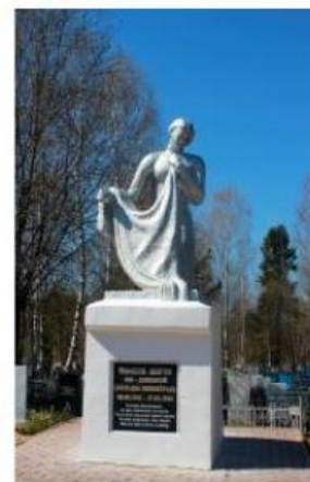
Костромская область, Шарья, посёлок Октябрьский Памяти жертв 900-дневной блокады Ленинграда