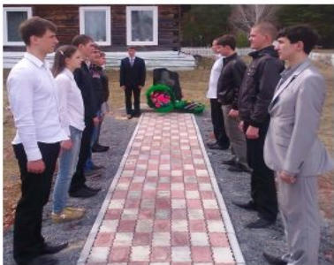
Красноярский край, Абанский район, деревня Высокогородец «Аллея Славы» в д. Высокогородец