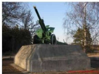
Тверь, поселок Затверечье, улица Шишкова Памятник — 122-миллиметровая (мм) гаубица