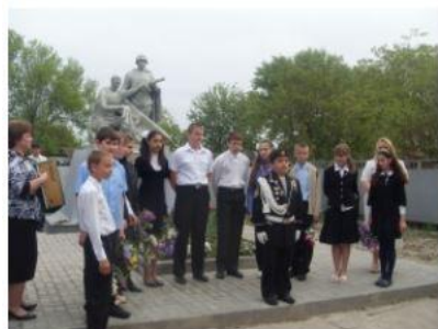
Ростовская область, Кагальницкий район, станица Кировская, улица Славы Воинское захоронение солдат, погибших при освобождении ст. Кировской в 1943 году.