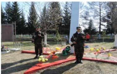
Иркутская область, Тайшетский район, село Берёзовка, улица 40 лет Победы «Парк Победы»