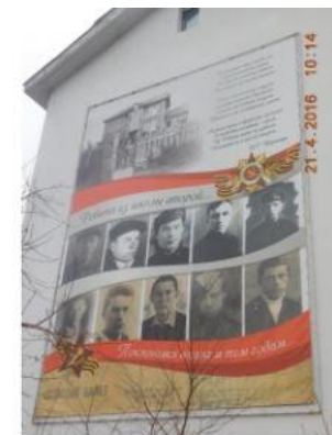
ХМАО, Ханты-Мансийск, Луговая улица 15 Памятный баннер «Ребята из школы второй»