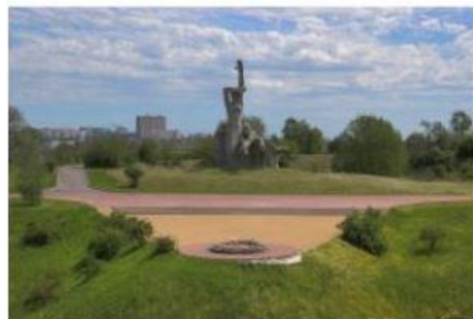
Ростов-на-Дону, Змиевский проезд Мемориальный комплекс жертвам фашизма «Змиевская балка»