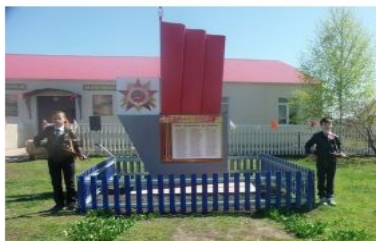
Республика Татарстан, Кайбицкий район, село Малые Меми, Центральная улица Памятник — стела павшим односельчанам на Центральной