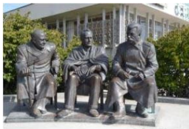
Республика Крым, городской округ Ялта, поселок городского типа Ливадия, улица Батурина Памятник И. Сталину, Ф. Рузвельту и У. Черчиллю — памятник лидерам «большой тройки»