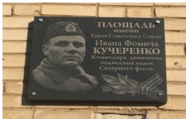
Приморский край, поселок городского типа Дунай Площадь им. И.Ф. Кучеренко