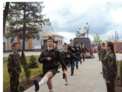
Ростовская область, Азовский район, село Elizavetovka Памятник в с. Elizavetovka установлен в память о погибших односельчанах в годы Гражданской и Великой Отечественной войны