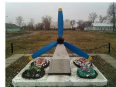
Курская область, Курский район, деревня Халино, улица Ачкасова Памятник лётчикам- разведчикам, погибшим в боях на Курской дуге.