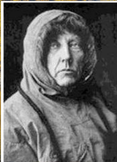
2 Руаль Амундсен, путешественник