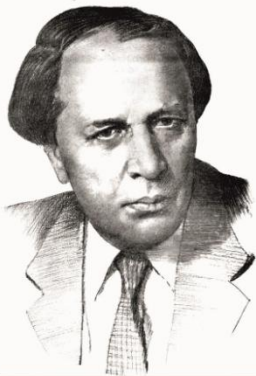
Алексей Николаевич Толстой 1883-1945