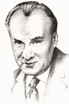
Николай Николаевич Носов 1908-1976