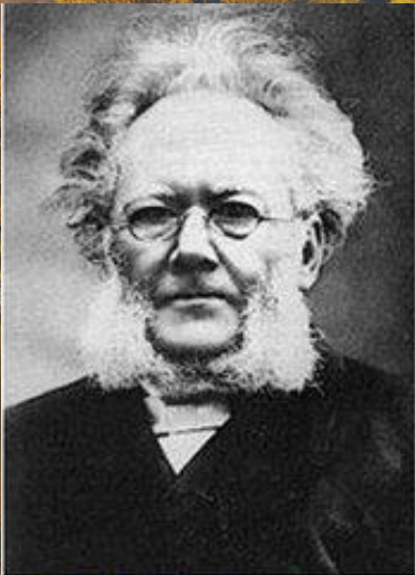
1 Хенрик Ибсен, драматург