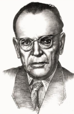
Константин Георгиевич Паустовский 1892-1968