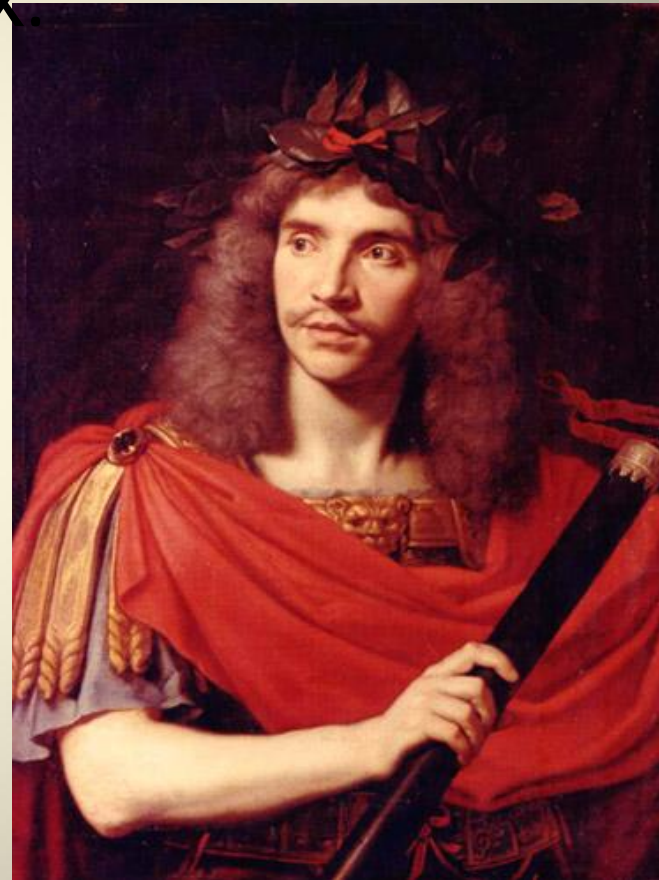
Жан-Батист Мольер. Портрет работы Николя Миньяра.