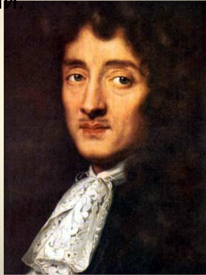
Жан Расин. Портрет работы Франсуа де Труа.