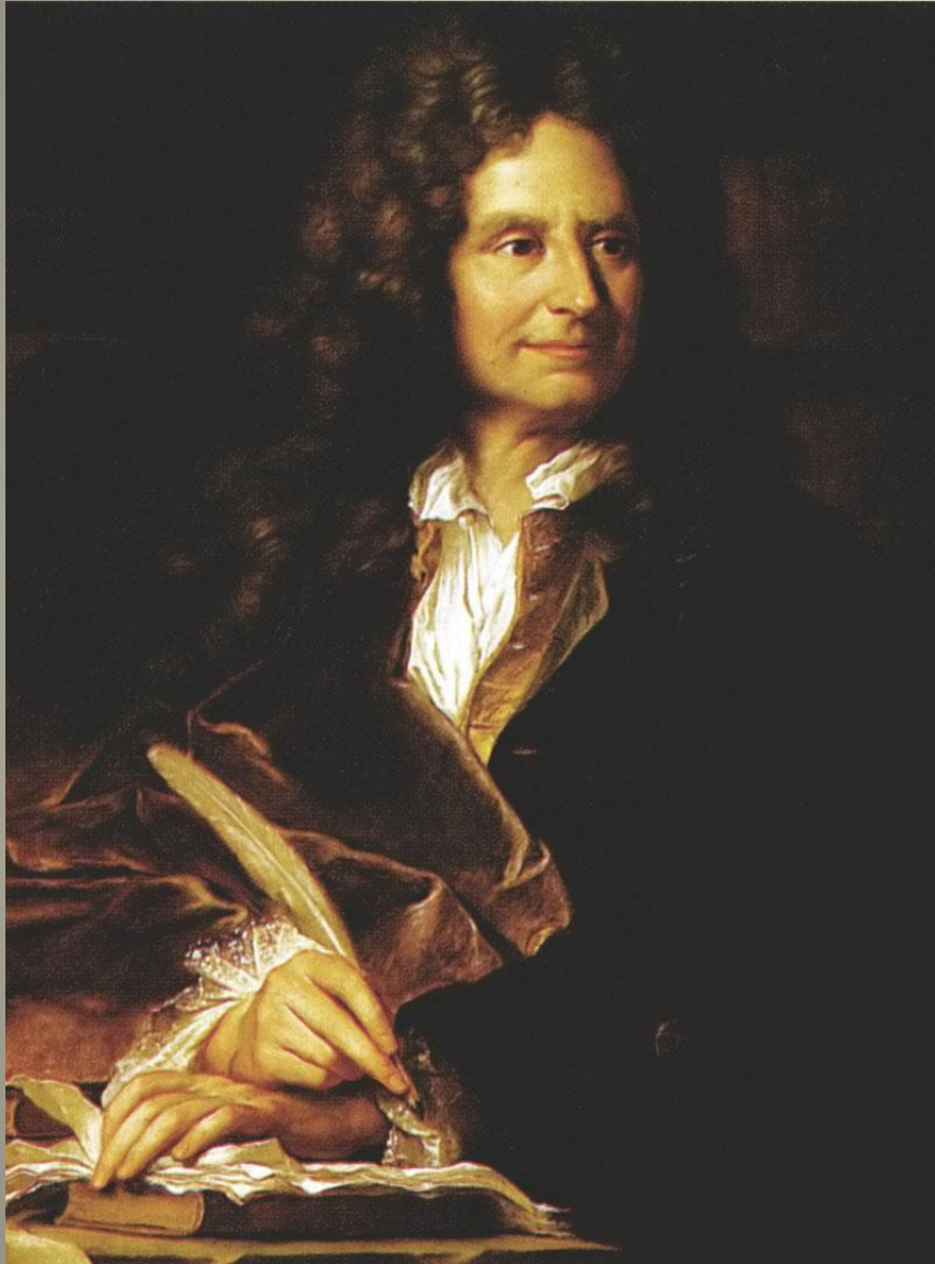
Никола Буало. Портрет работы Гиацинта Риги.

Классицисты создали для литературы свод правил , определяющий законы красоты и регламентирующий творчество.