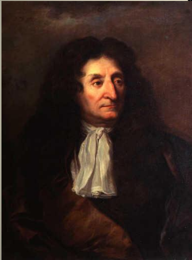
Жан де Лафонтен. Портрет работы Гиацинта Риго.